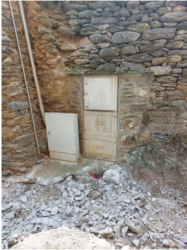
1.tapar caixes de connexions davant Cal Peraire – zona 8