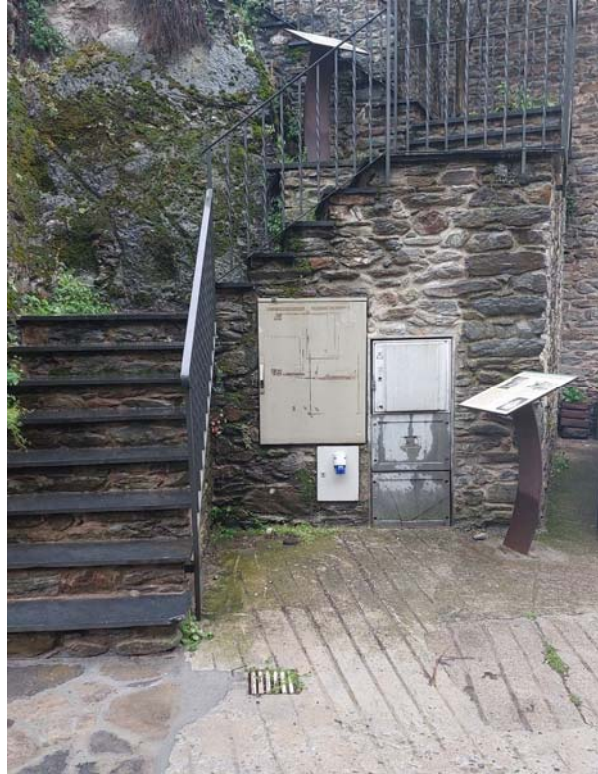
3 caixes de llum encastades a mur d'escala