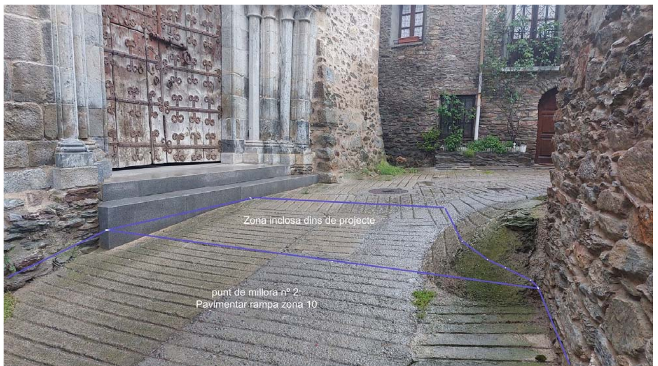
Esquema dels nous nivells de plaça i rampa d'accés. El final de la plaça pujarà 14cm respecte la cota actual