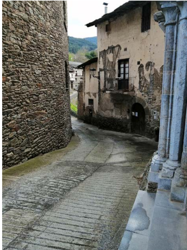
2. zona de rampa arribada a la Plaça de l'església