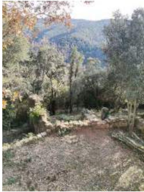
Zona de l'antic cementiri