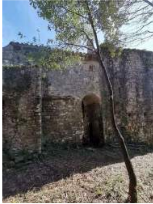
Façana nord església, rectoria i torre