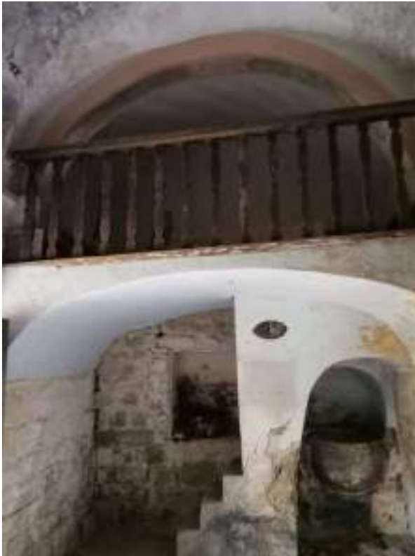
Església mirant el cor