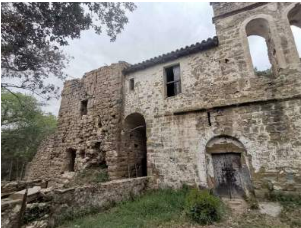
Façana sud del conjunt amb la torre consolidada