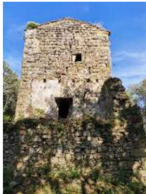
Façana oest de la torre