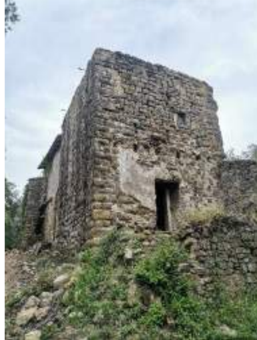
Façana oest de la torre