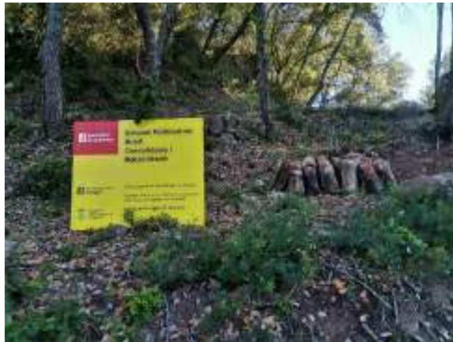
Cartell de les obres executades

El desembre del 2022, per tal de poder consolidar la torre i poder-la estudiar a fons per a poder-hi actuar es va procedir a la neteja de la runa interior, l'enderroc del forjat de la primera planta així com l'eliminació de la vegetació dels seus murs exteriors.