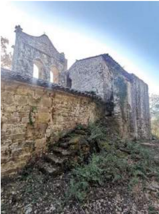
Façana nord del conjunt