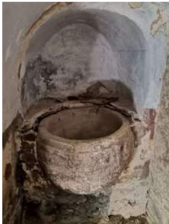
Detall de la pica baptismal romànica