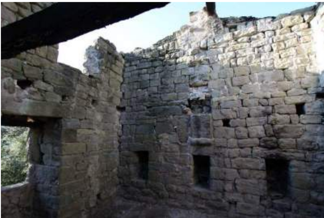
Murs de les façanes sud i oest – planta primera