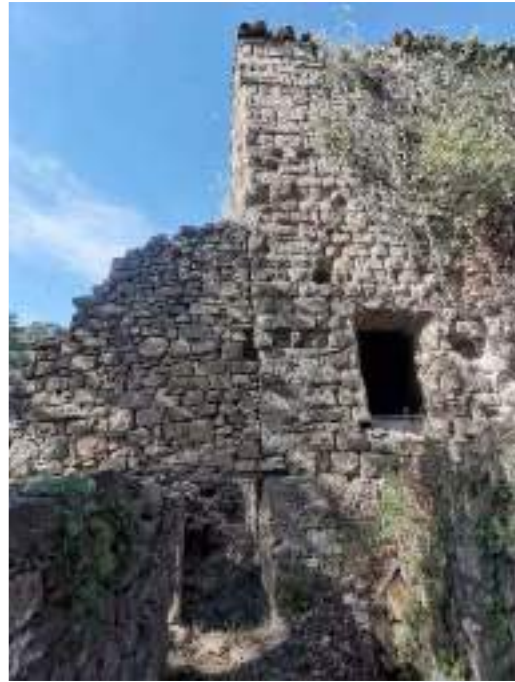
Edificació en ruïnes annexada a façana sud