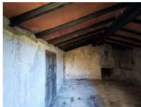
Rectoria – murs sud i oest