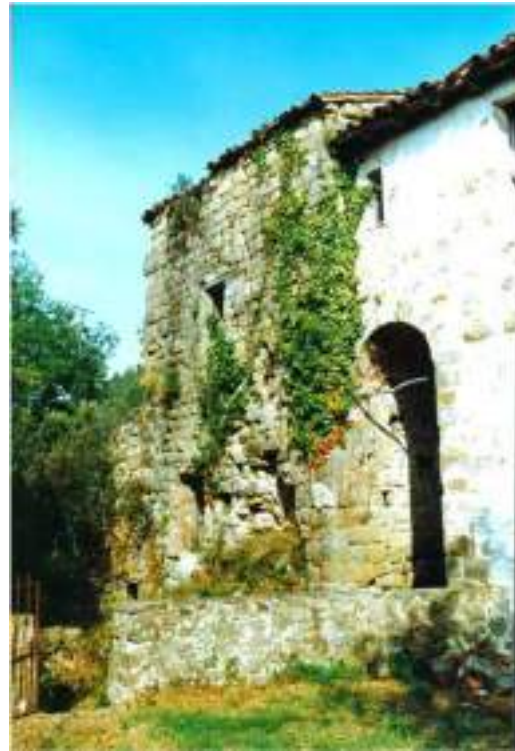
La torre i la rectoria – façana sud