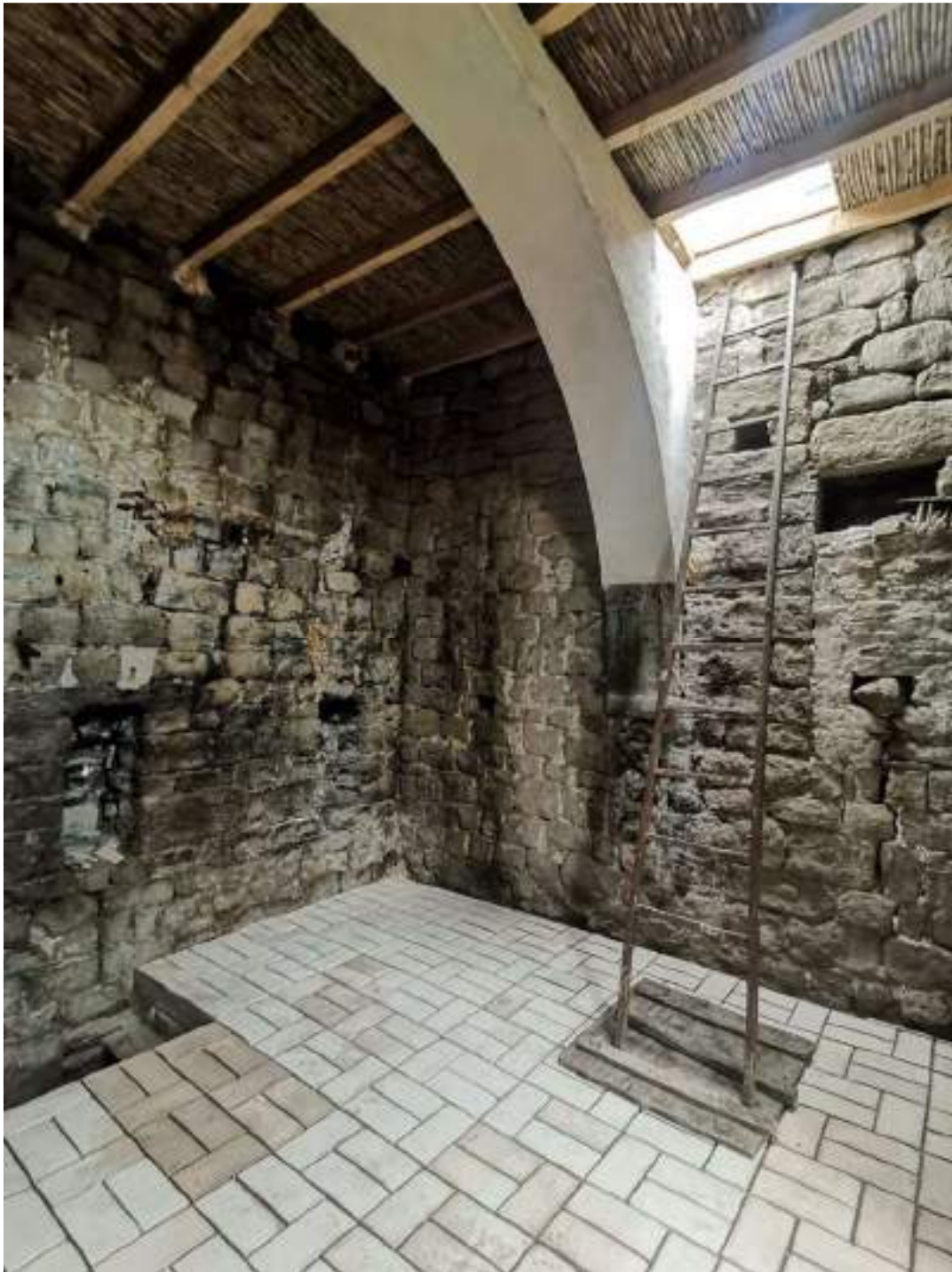
Planta primera amb nou forjat amb acabat de canyes – murs nord i est