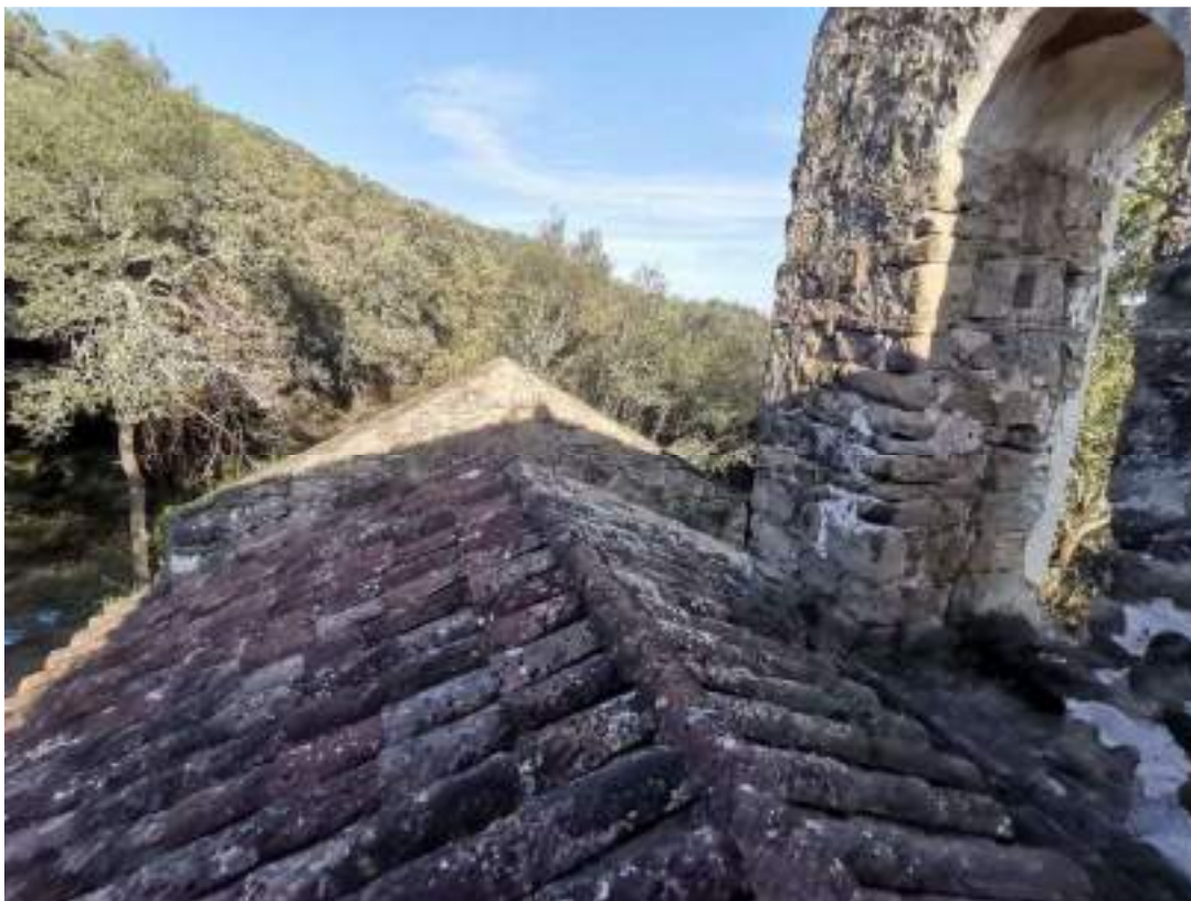
Coberta església mirant l'absis a l'est