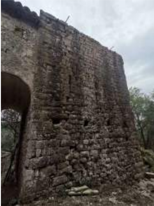
Façana nord de la torre

A finals de març de 2023, la torre ha quedat consolidada recuperant la seva forma original amb la restitució de l'arc de la primera planta (que només tenia les arrancades) i la recuperació de la coberta plana, esperant noves actuacions per a poder-la acabar.