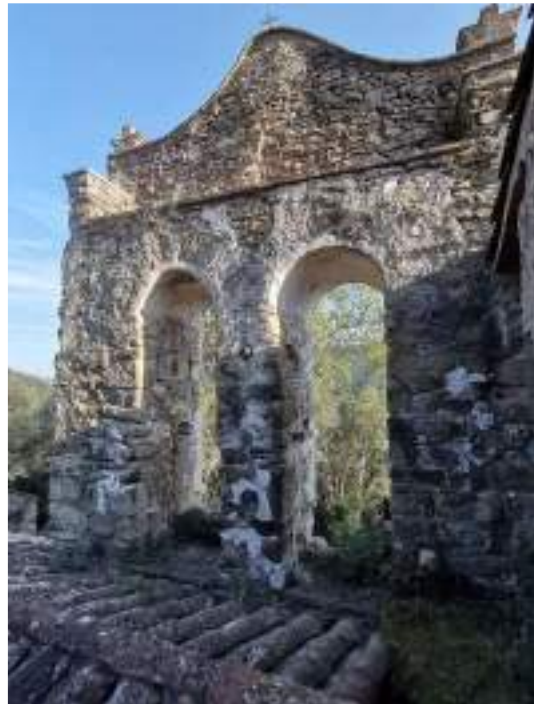
Escales accés a rectoria sobre del teulat i campanar espadanya església – façana nord