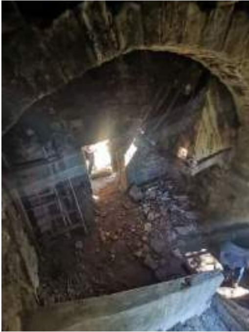
Planta baixa – porta entrada