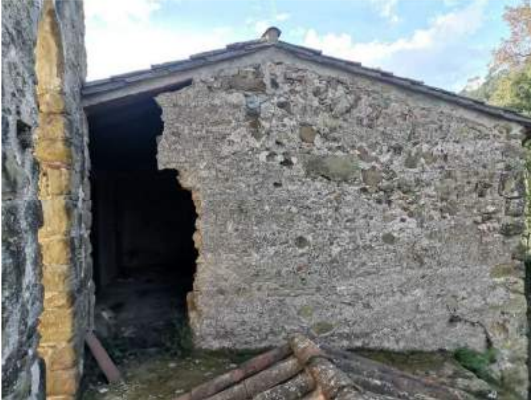
Entrada rectoria per la passera situada a la coberta de l'església