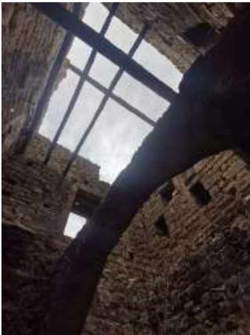
Visió des de la planta baixa