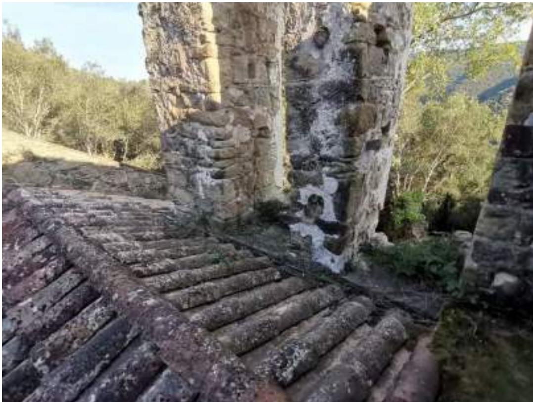
Coberta de l'església