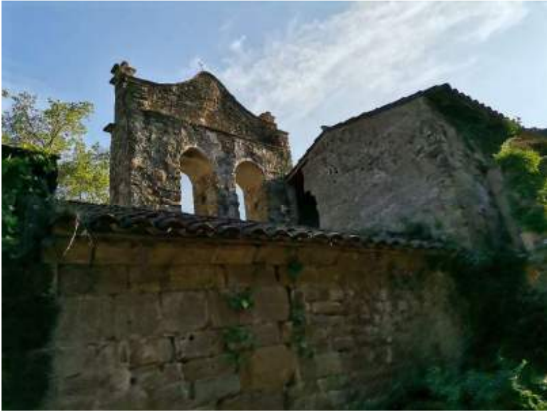
L'església i la rectoria – façana nord