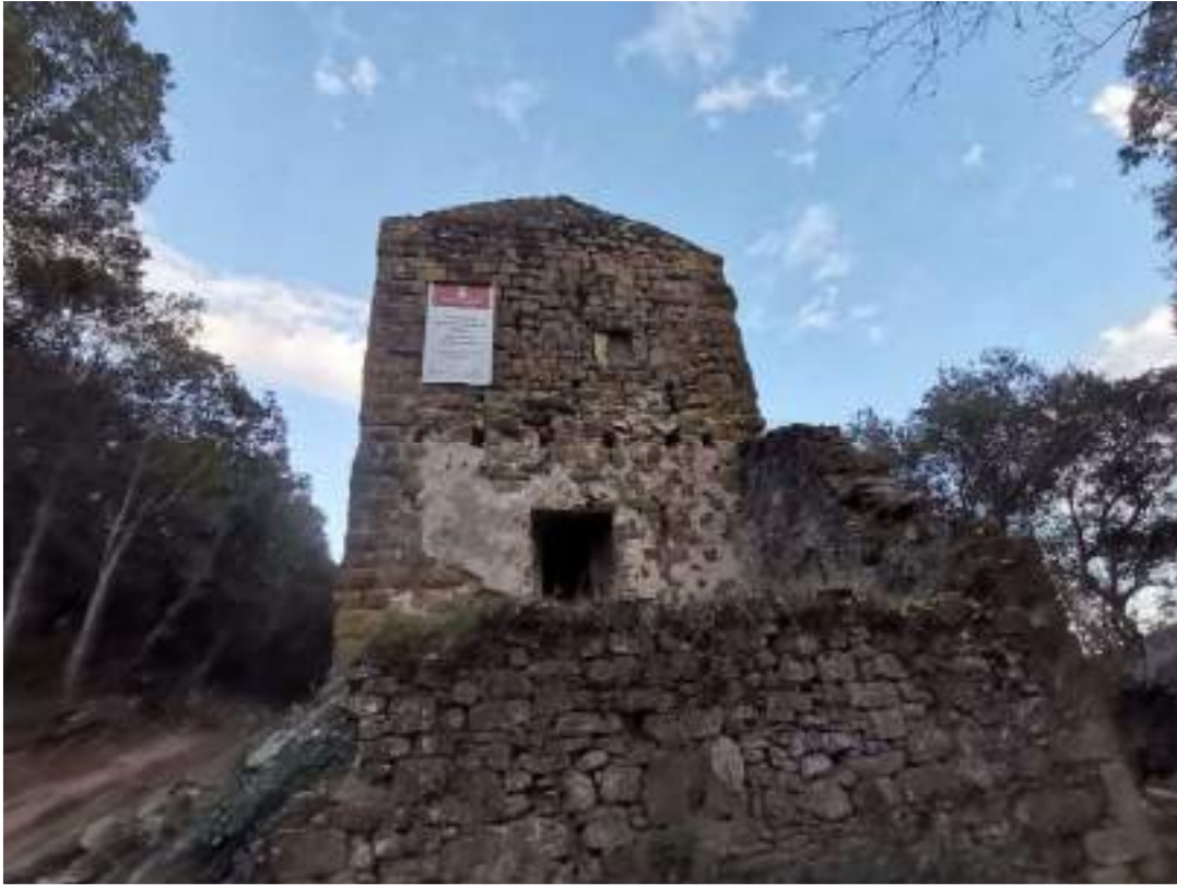
Façana oest de la torre