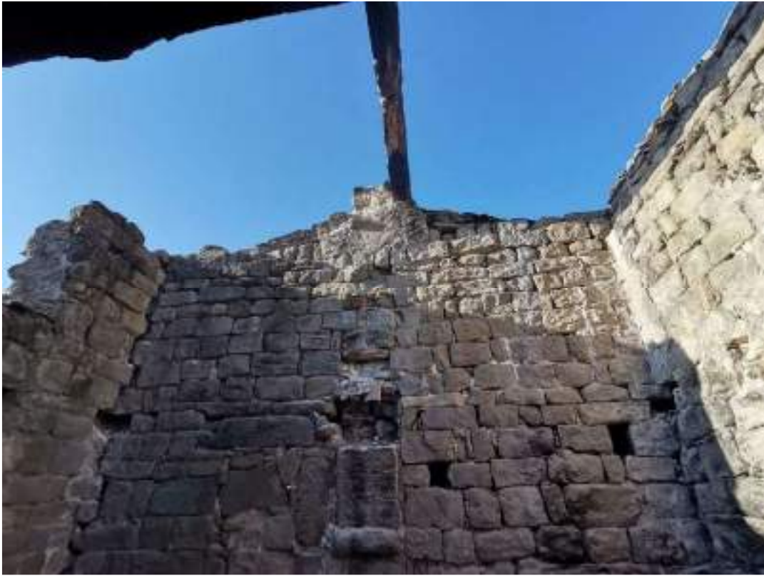
Mur de la façana oest – planta primera