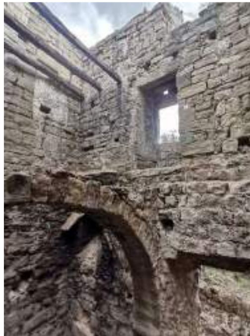
Arrancada de l'arc de la planta des del mur sud