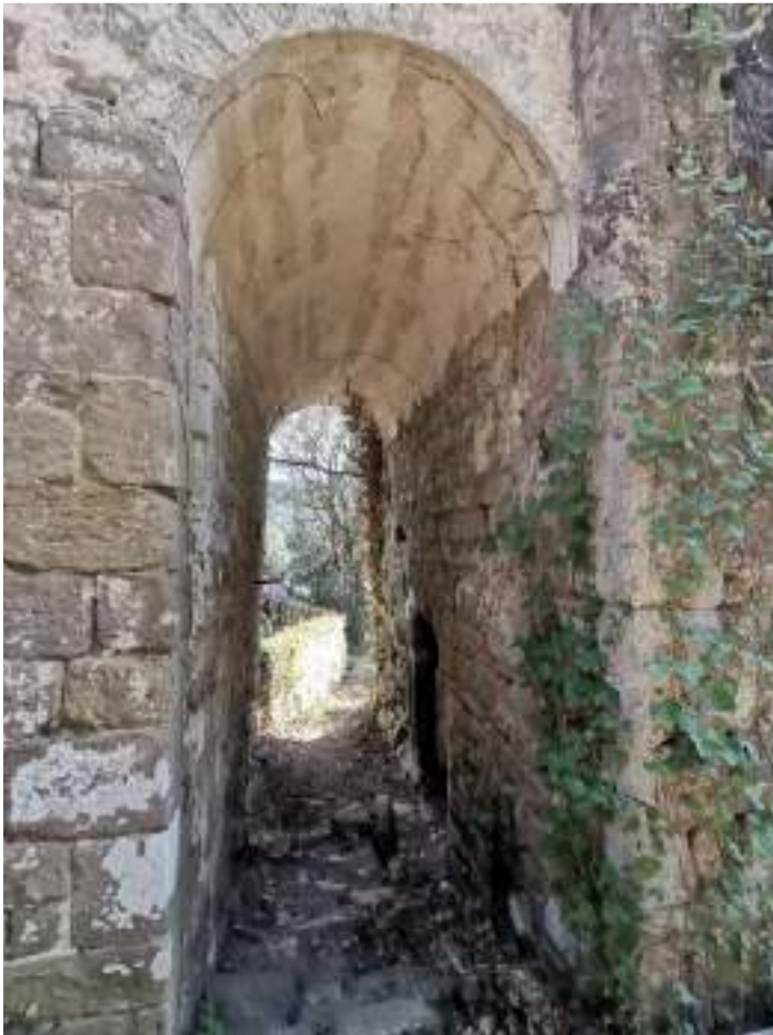
Pas cobert entre la torre i l'església