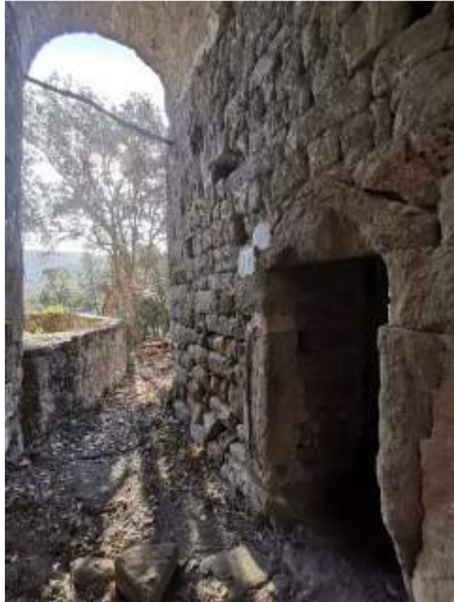
Façana est de la torre amb la porta d'accés