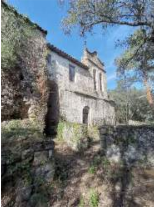
Façana sud de la torre, l'església i la rectoria