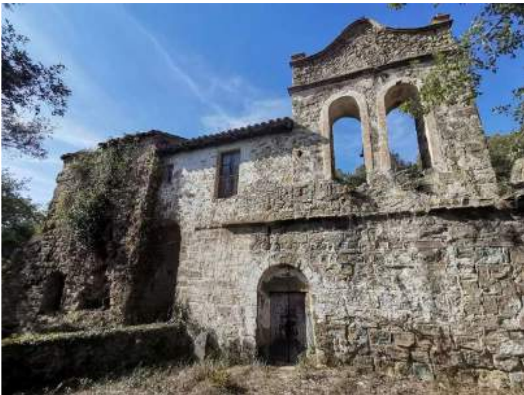
Façana sud de la torre, l'església i la rectoria