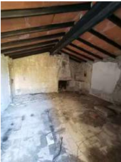
Rectoria – mur oest