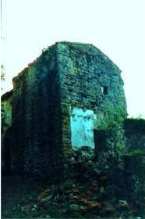
La torre – façanes nord i oest