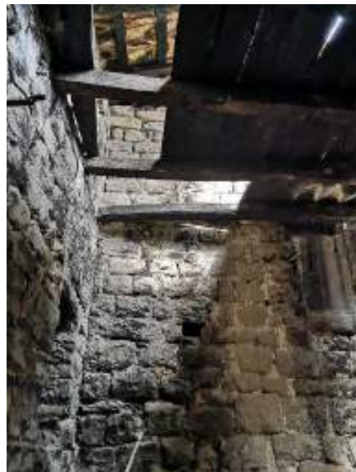
Planta Primera – mur orientat a est