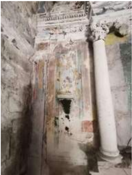
Detall retaule – part esquerra