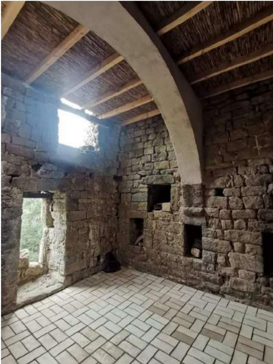
Planta primera amb nou forjat amb acabat de canyes – murs sud i oest