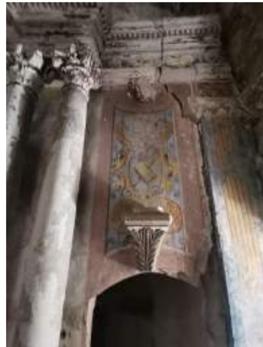
Detall retaule - part dreta