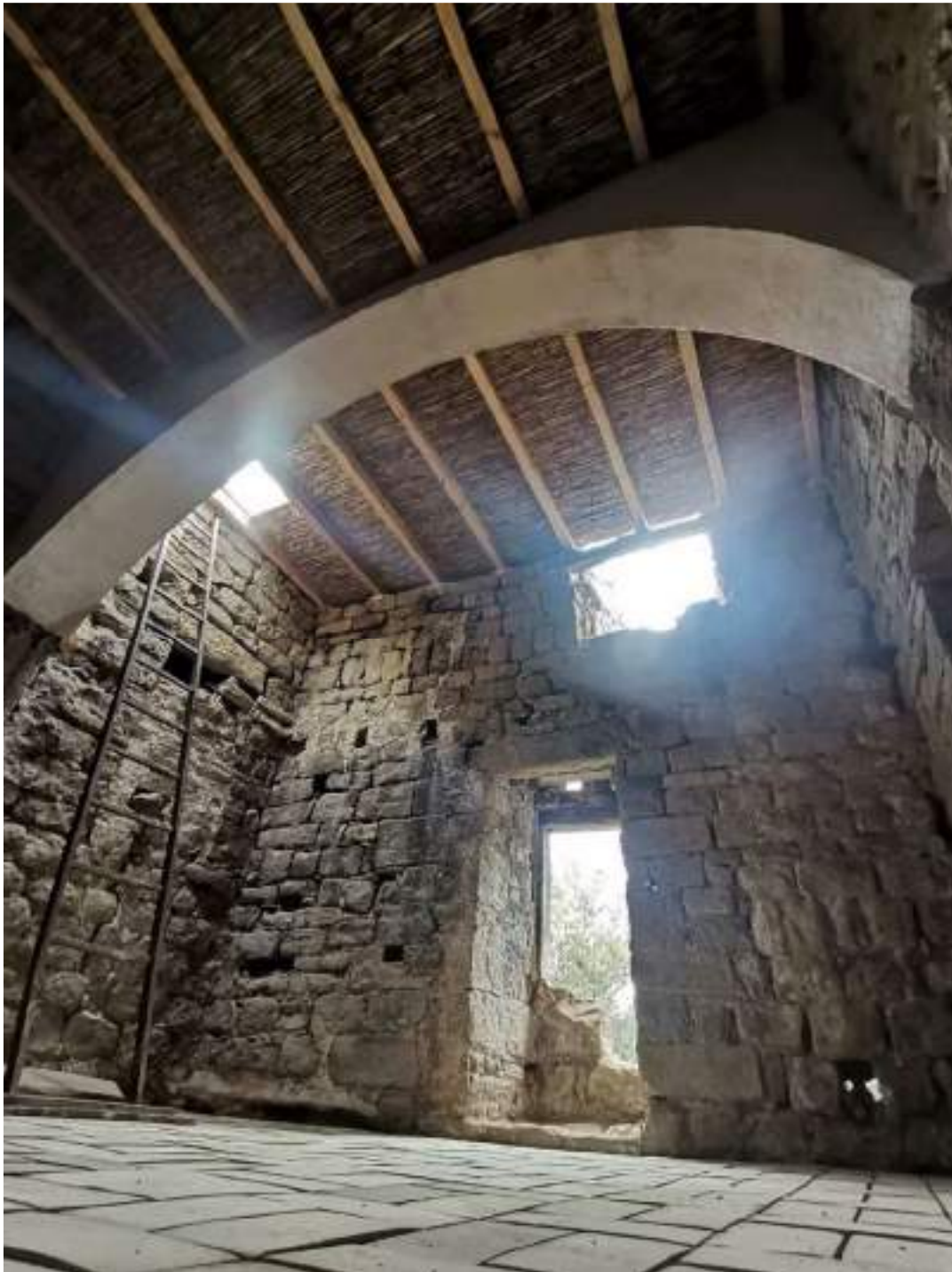
Planta primera amb nou forjat amb acabat de canyes – mur sud