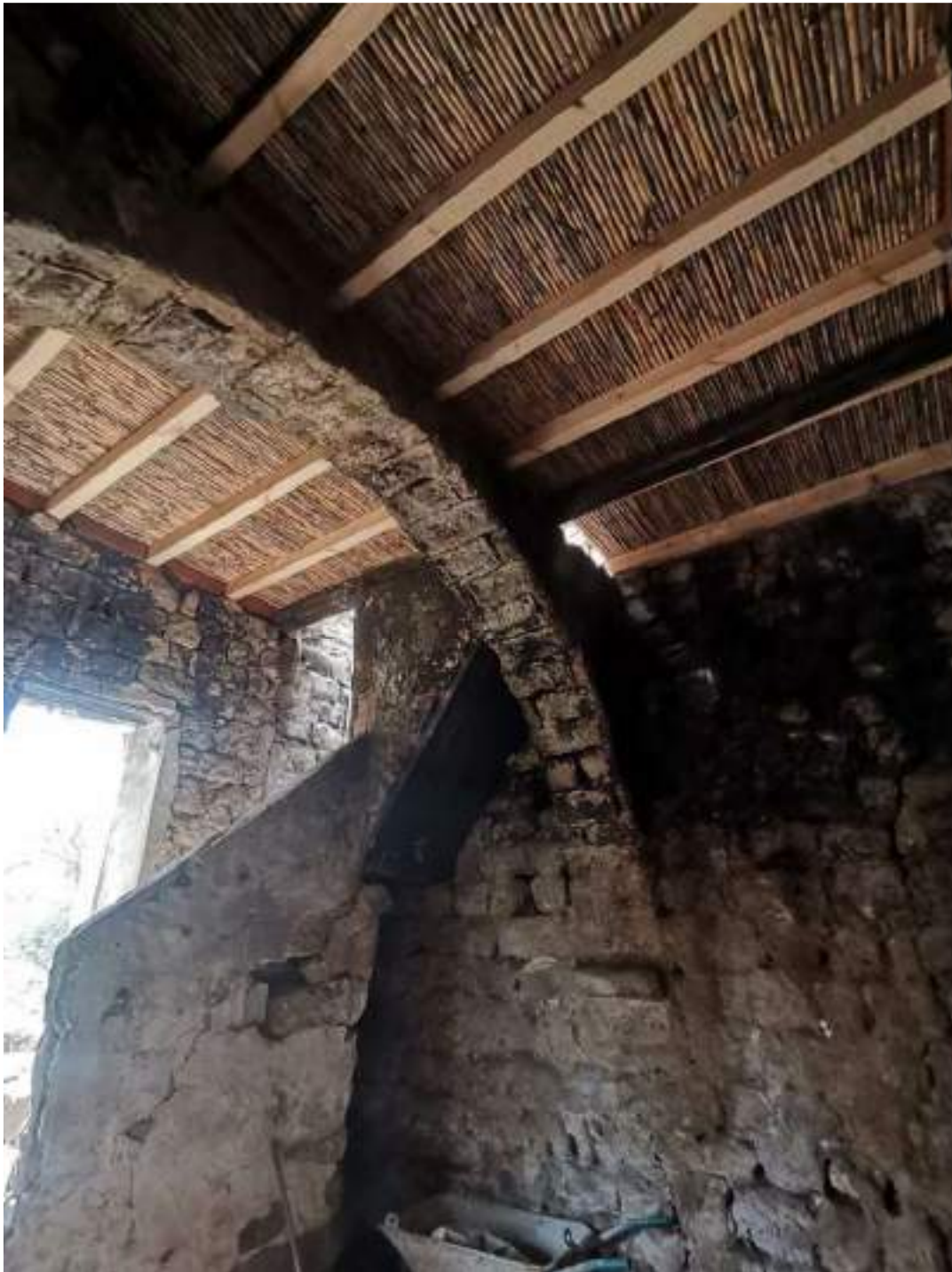
Planta baixa amb nou forjat amb acabat de canyes i arribada de l'escala