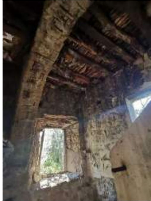
Planta Baixa – finestra a sud