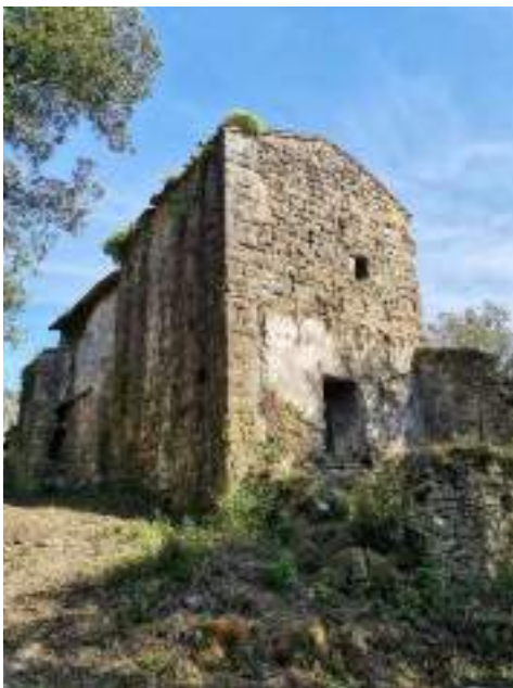
Façanes nord i oest de la torre