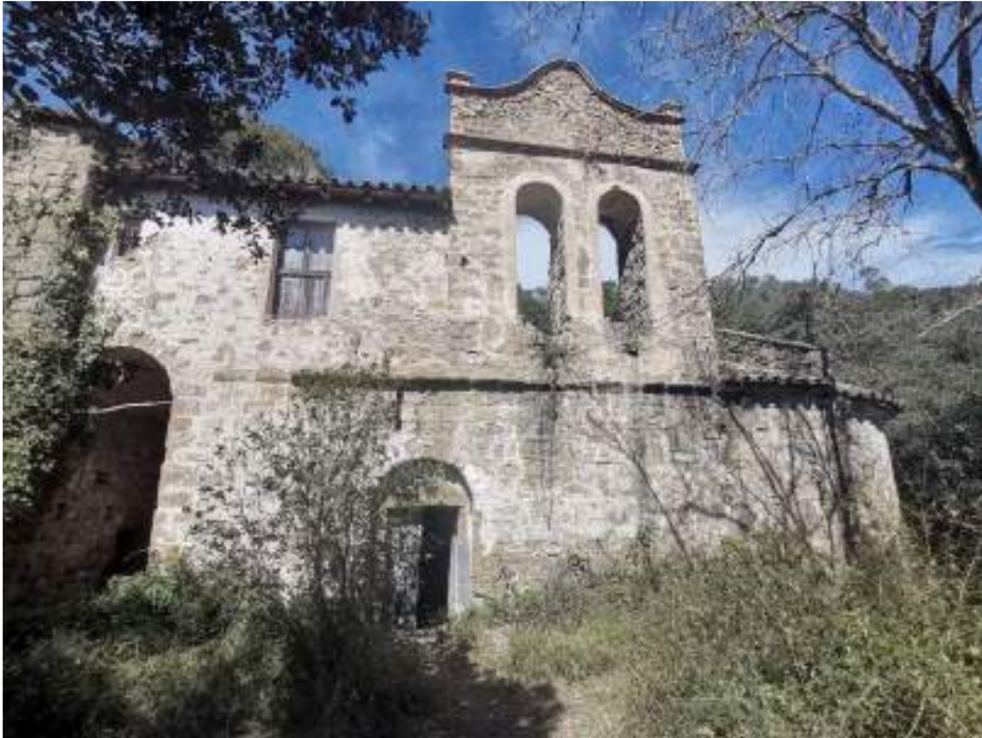
L'església i la rectoria – façana sud