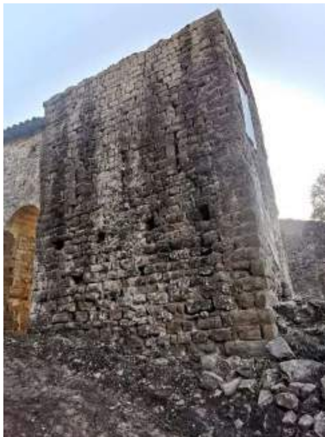
Façana nord de la torre