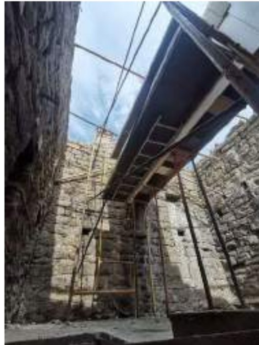
Encofrat de l'arc restituit a la primera planta