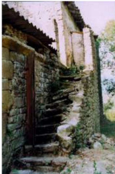
L'escala d'accés a la rectoria