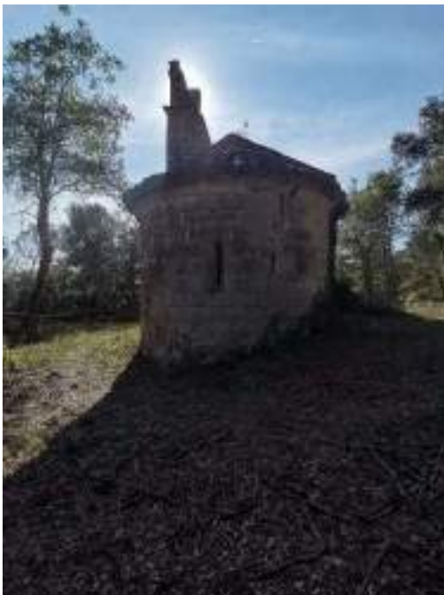
Absis de l'església a la façana est