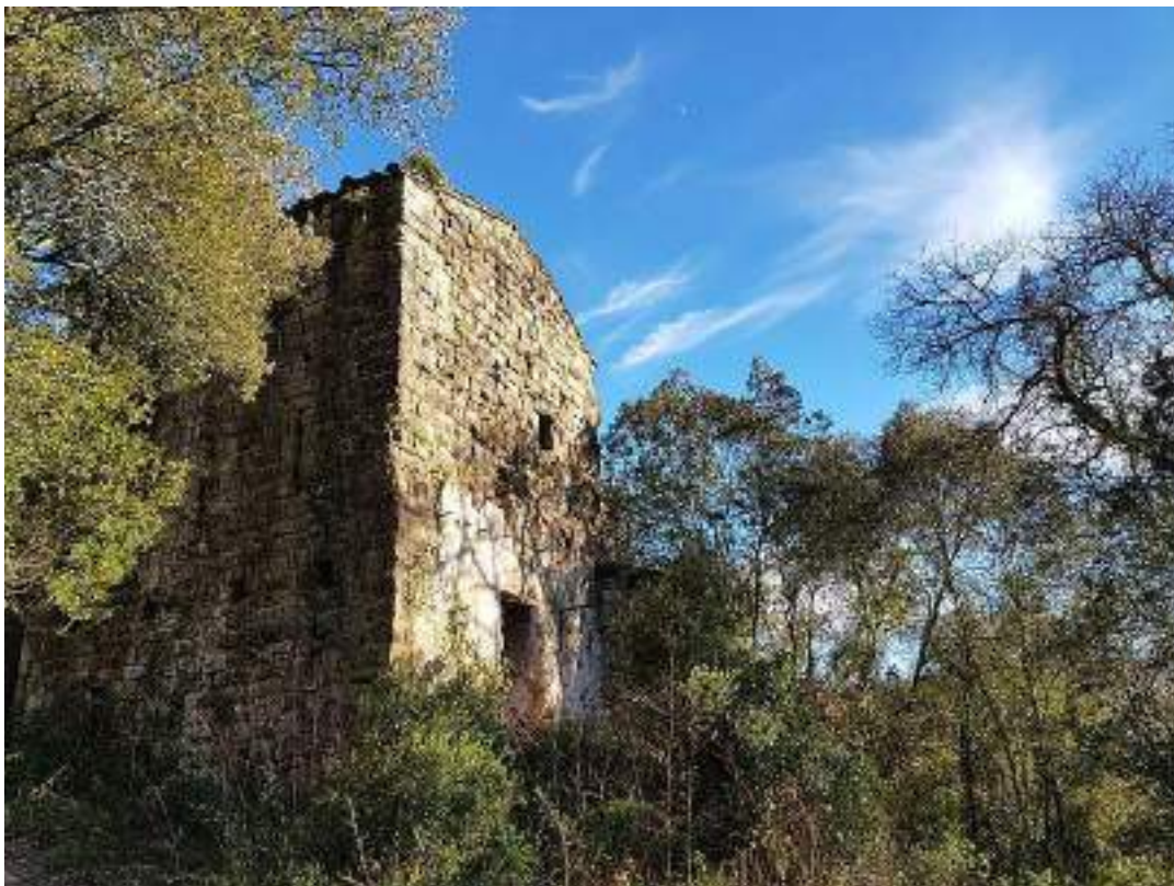
La torre des del seu exterior – façanes nord i oest