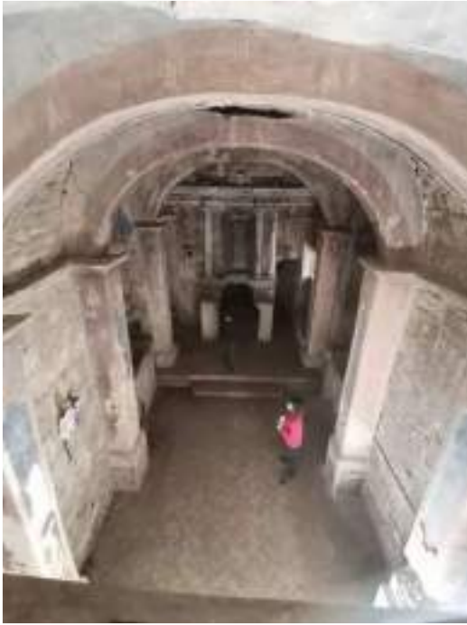
Església mirant a l'absis