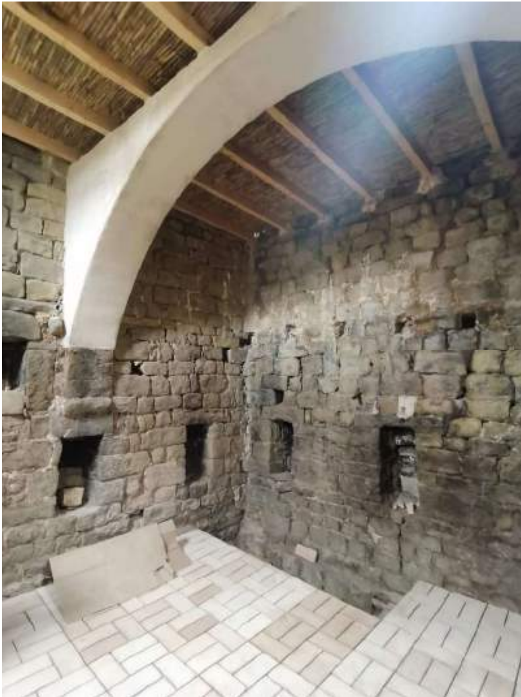
Planta primera amb nou forjat amb acabat de canyes – murs oest i nord