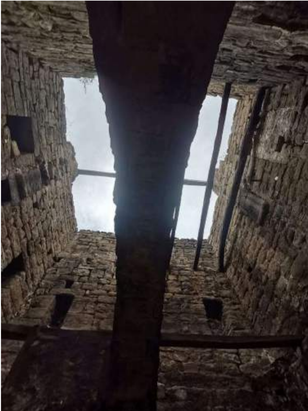
Part inferior de l'arc de la planta baixa