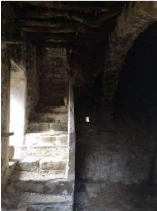
Planta Baixa – escala