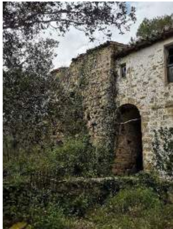
Torre i part de la rectoria – façana sud