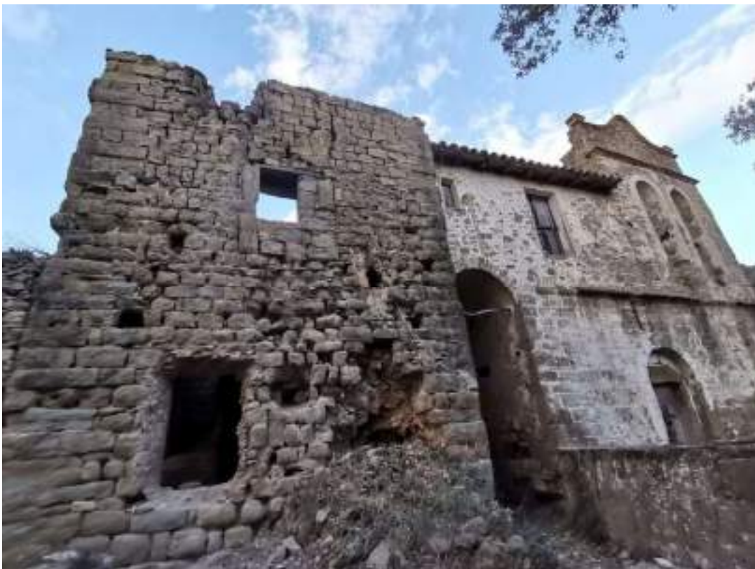
Façana sud de la torre