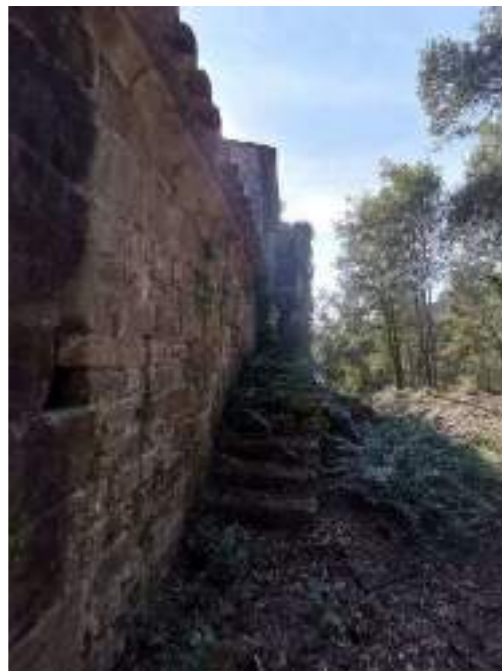
Escala de pujada a la rectoria a la façana nord