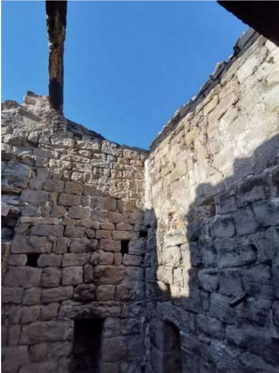
Murs de la façanes est i sud – planta primera