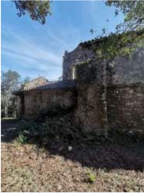
Façana nord església i rectoria