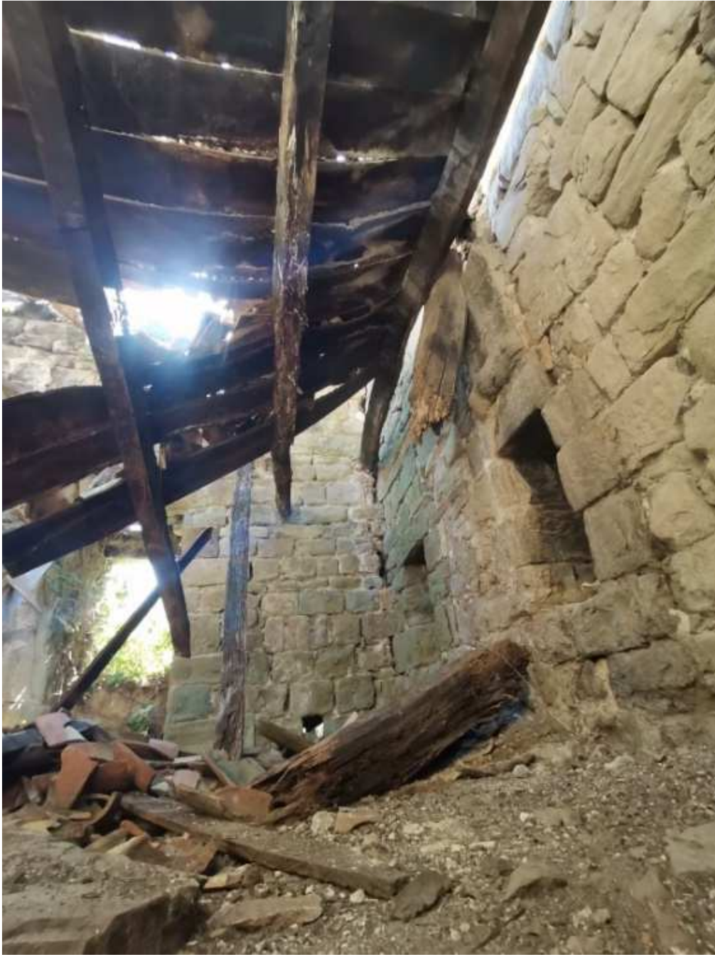
Planta primera – murs sud i oest