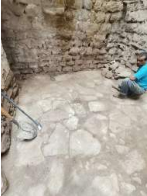
Paviment original de la planta baixa