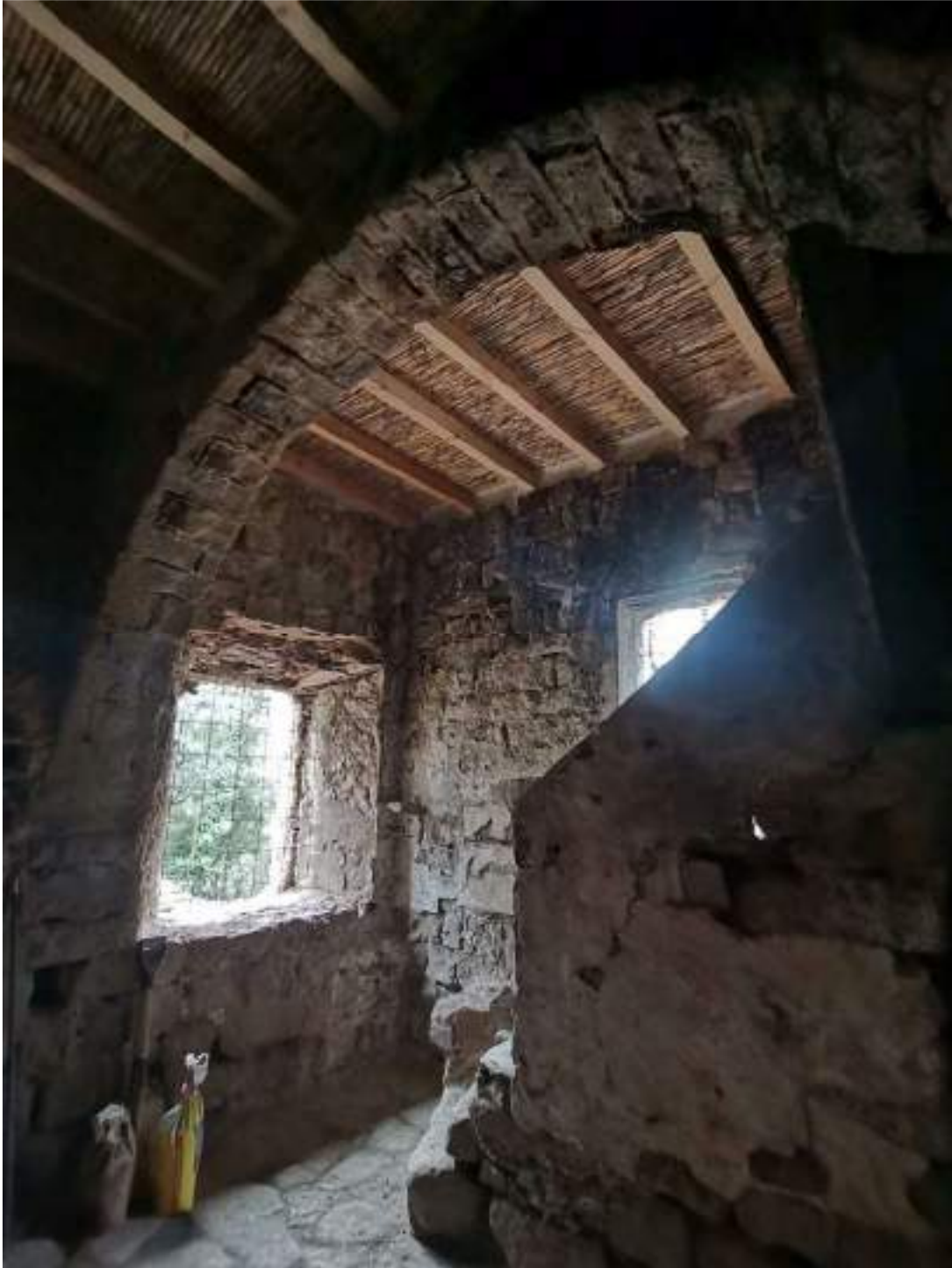
Planta baixa amb nou forjat amb acabat de canyes i arrancada de l'escala