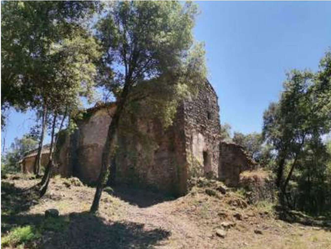
Façanes nord i oest de la torre i la rectoria

A inicis de la tardor de 2021, l'ajuntament va començar a actuar a la zona. Primerament va fer una neteja de massa forestal i vegetació de l'entorn immediat del conjunt.