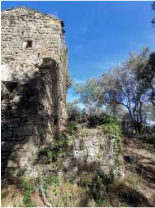
Edificació en ruïnes annexada a façana oest