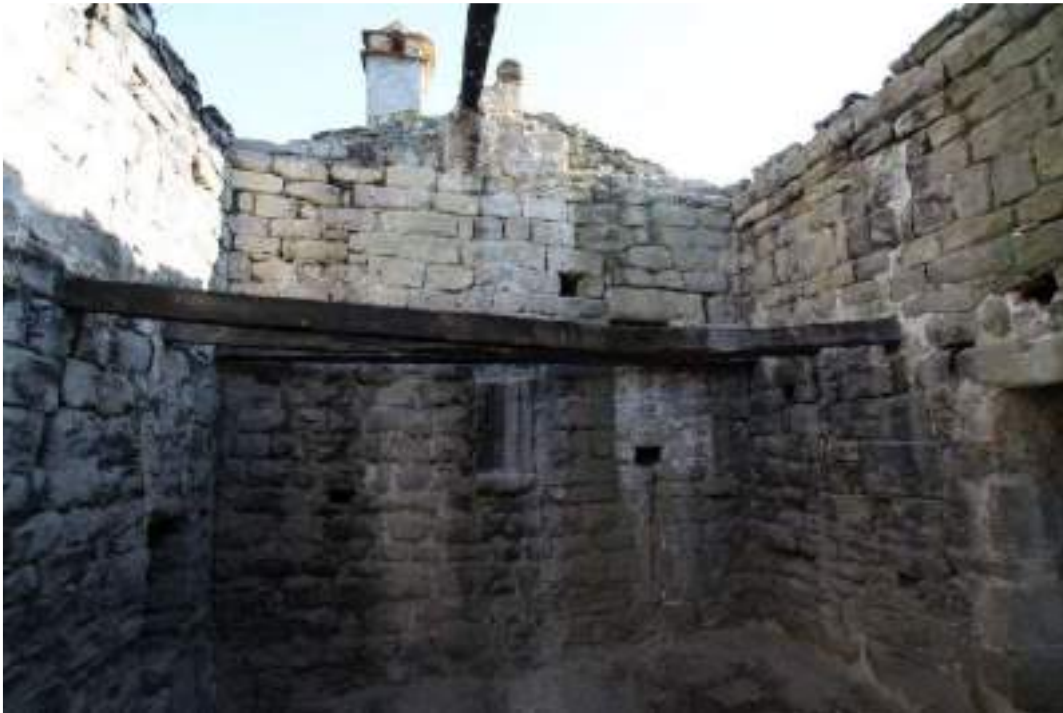
Murs de les façanes nord, est i sud – planta primera