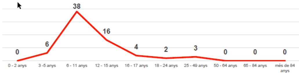
Gràfica 3: Alumnat per franges d'edat

En l'alumnat per franges d'edat, la franja més representada és la dels 6 a 11 anys, a molta distància de la resta de franges. Hi ha nul·la representació de 0 a 2 anys i de 50 anys i més.