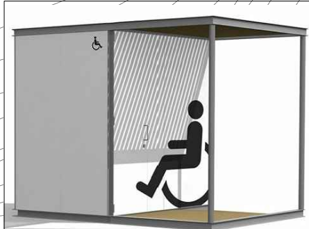
MÒDUL WC SEC