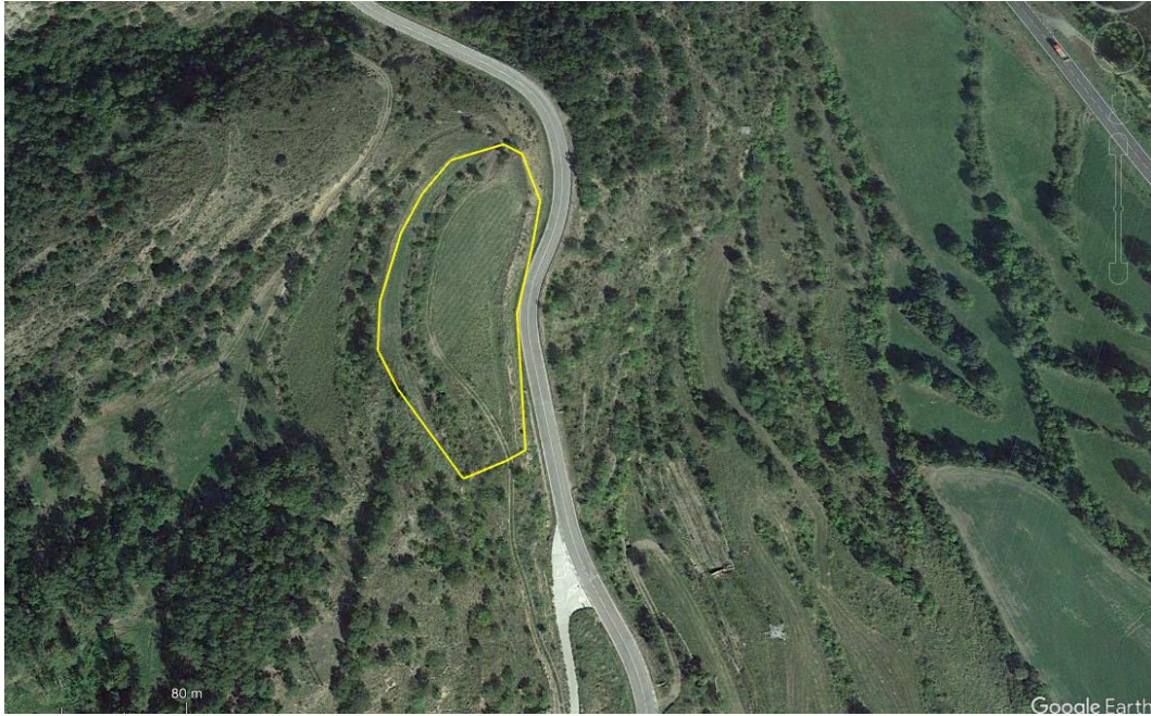
Ortofotomapa del camp de vinya experimental