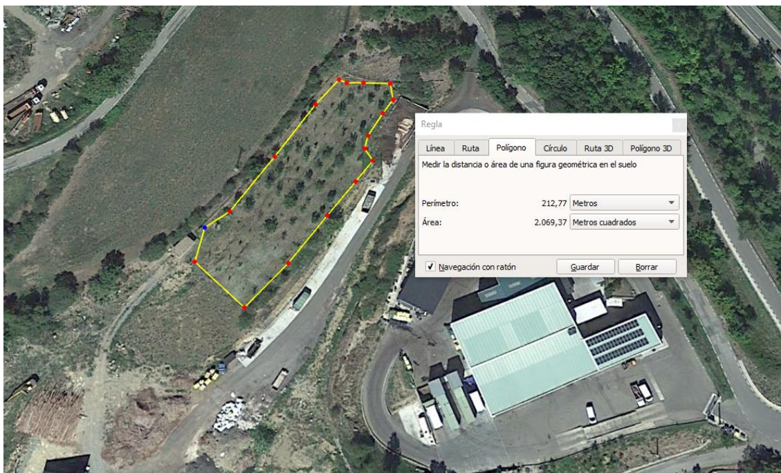
Ortofotomapa del viver d'arbres fruiters de varietats locals