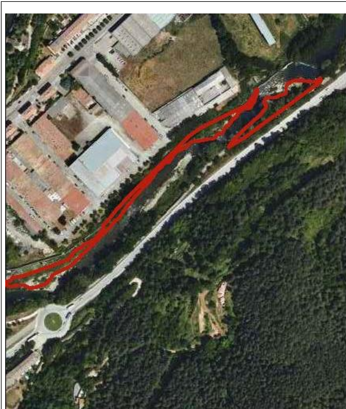
Plànol(s) general de localització de l'actuació al municipi amb indicació dels punts d'inici i final.