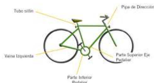
Posibles ubicacions del Número de Bastidor: