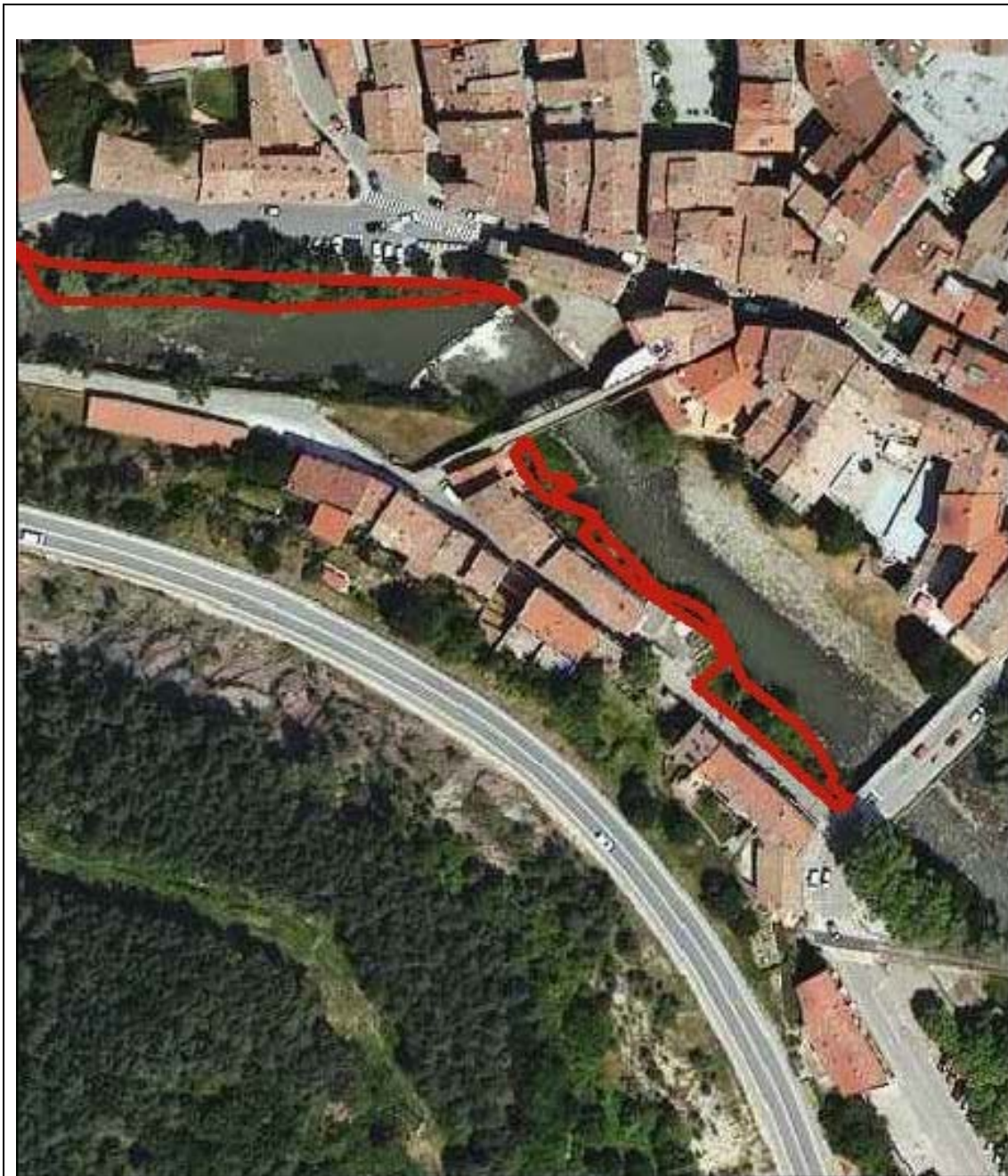
Plànol(s) general de localització de l'actuació al municipi amb indicació dels punts d'inici i final.