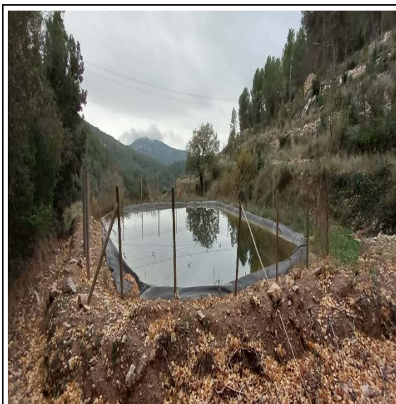
Figura 13. Estat punt d'aigua "Font Santa Agnès"

Els treballs consistiran en l'extracció del tancament i la gestió dels residus.