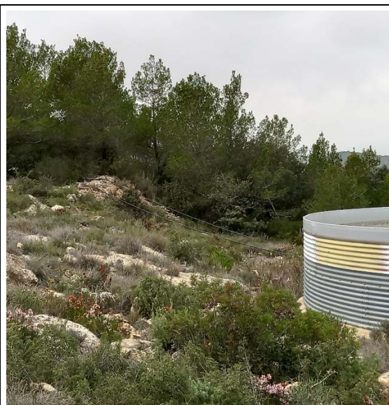
Figura 12. Estat punt d'aigua "Santa Agnès/ Coll Arboçar"