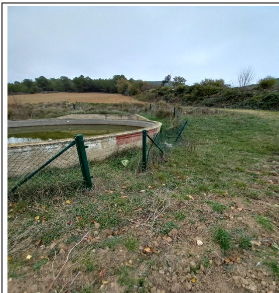
Figura 9. Estat punt d'aigua "Valldossera"

Els treballs consistiran en la reparació del tancament.