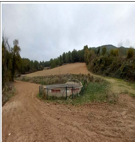
Figura 10. Estat punt d'aigua "Valldossera"