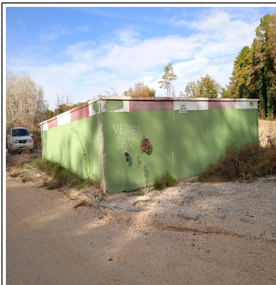
Figura 3. Estat punt d'aigua "Les Costes"

Els treballs consistiran en la reparació de les pèrdues d'aigua.