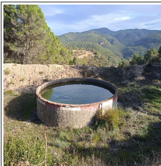
Figura 2. Estat punt d'aigua “Mas Baldrich”

Els treballs consistiran en la neteja de les totxanes trencades fins aconseguir una superfície uniforme, l'arrebossat de la part superior per poder ser pintada i la gestió dels residus.