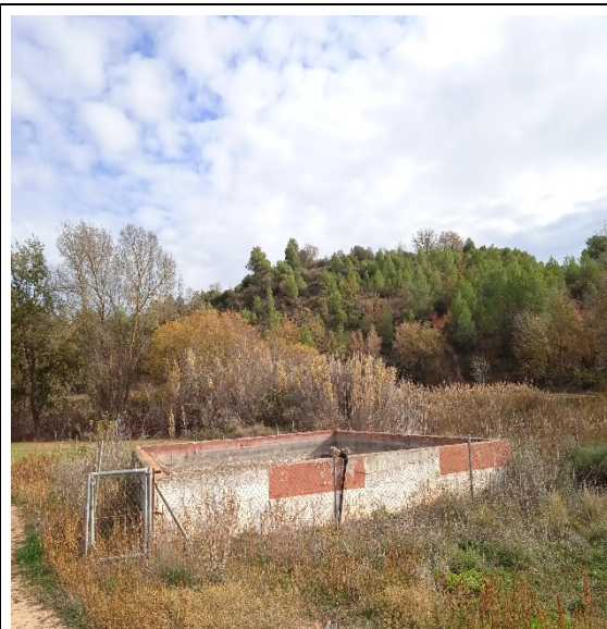
Figura 5. Estat punt d'aigua "Barranc Hortets"