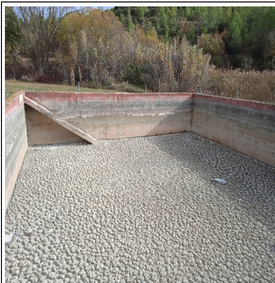
Figura 4. Estat punt d'aigua "Barranc Hortets"

Els treballs consistiran en extreure els sediments de manera mecanitzada i/o manualment, netejar i arrossar la part malmesa de l'arlequinat, extreure el tancament i gestionar els residus.