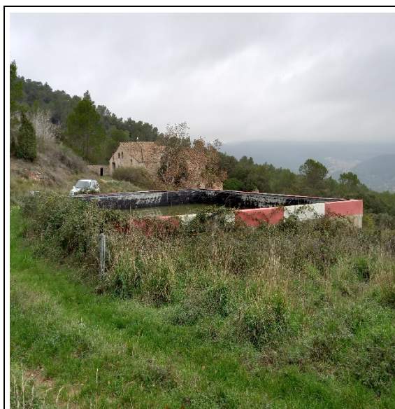
Figura 7. Estat punt d'aigua "Mas d'en Bosc"

Els treballs consistiran en la reparació del tancament i el desbrossament de la superfície interior d'aquest.