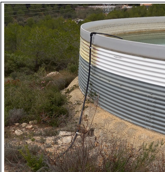
Figura 11. Estat punt d'aigua "Santa Agnès/ Coll Arboçar"

Els treballs consistiran en soterrar els tubs.