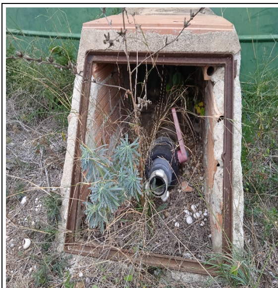
Figura 1. Estat punt d'aigua “Mas Fortuny”

Els treballs consistiran en col·locar una tapa a l'arqueta