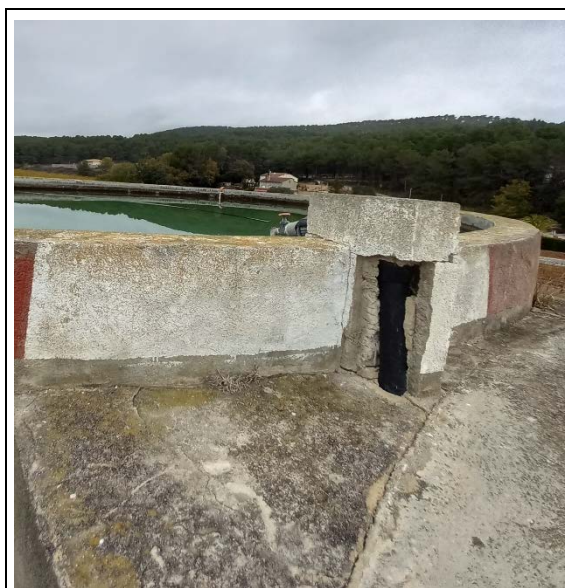
Figura 8. Estat punt d'aigua "Ranxos de Bonany"

Els treballs consistiran en la neteja de la part superior del dipòsit i en arrebossar la part superior malmesa del punt d'aigua.