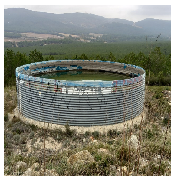
Figura 6. Estat punt d'aigua "Mas Gassons"

Els treballs consistiran en la neteja de la superfície del dipòsit, la substitució de la lona i la gestió dels residus.