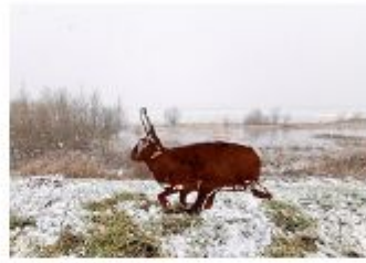
Descripció de foto 2 Model de figura de corten de la fauna