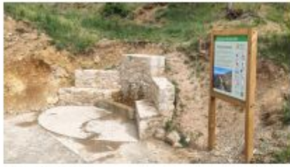
Descripció de foto 1 Font del Vermell, rebuda de visitants