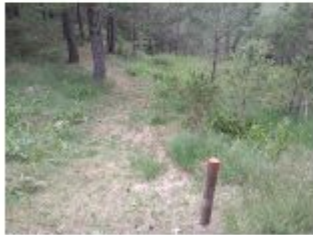
Descripció de foto 3 Fita de seguiment existent