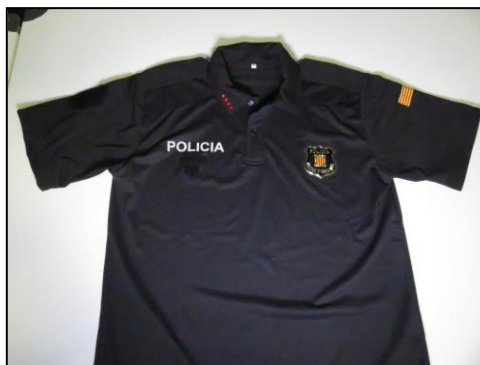
Total de mostres rebudes: polo tècnic de màniga curta, pantaló tècnic elàstic i pantaló curt

En relació al compliment de les característiques tècniques prescrites en la licitació, no s'han detectat deficiències ni mancances en les mostres.