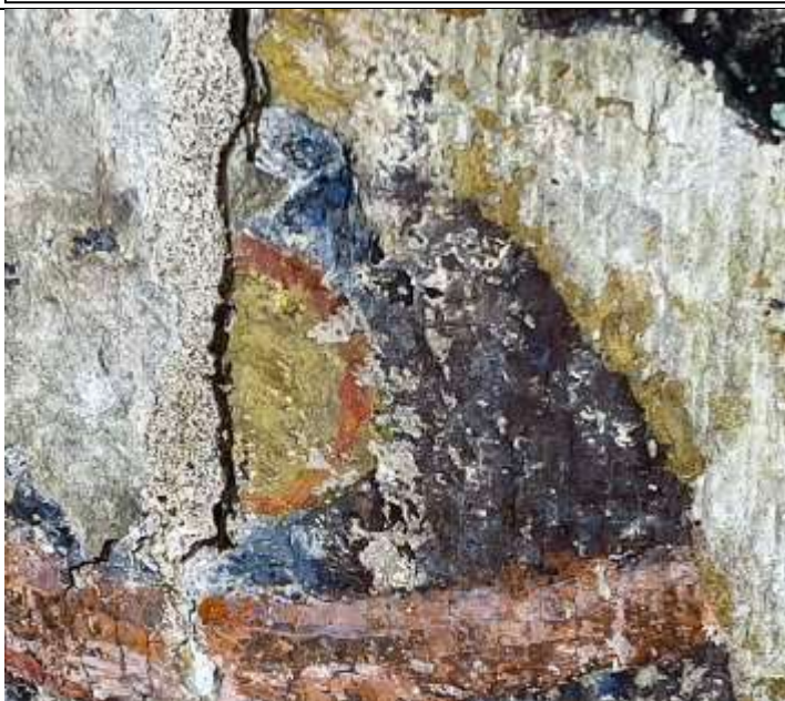
Forma decorativa amb aplicació d'or posada al descobert en la primera fase