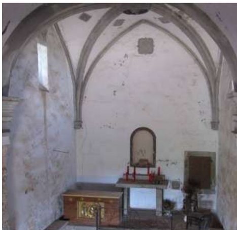
Vista de tota la part policromada a descobrir, abans de la primera intervenció (volta del presbiteri i parets laterals)