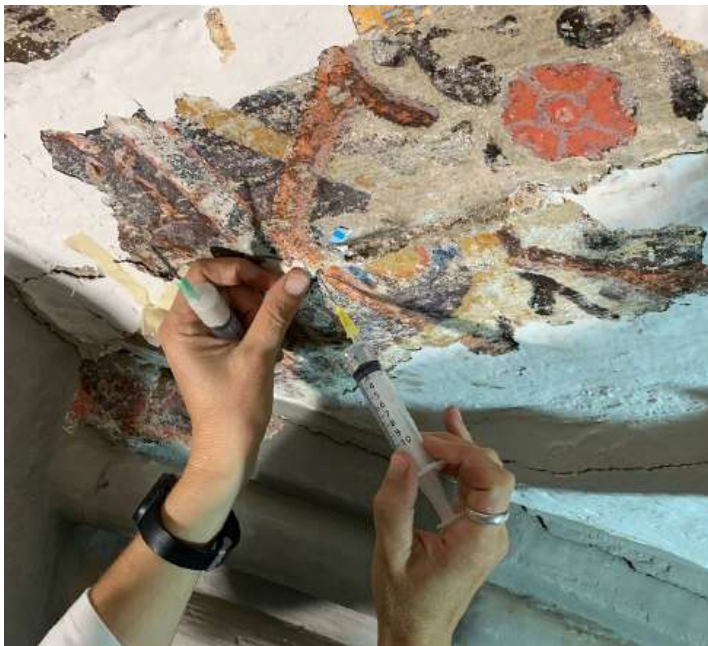
Consolidació de policromia en una de les plementeries de la volta durant la primera fase.