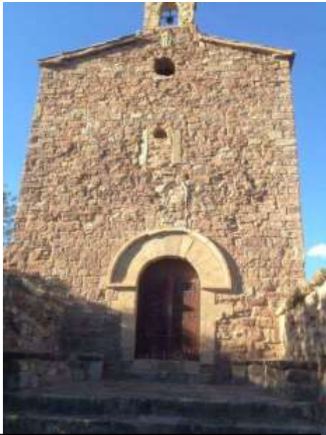
Vista general de l'ermita de Sant Francesc