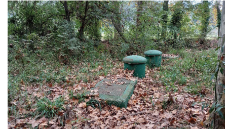
Figura 10 Depuradora de Can Costa