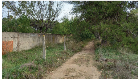
Figura 12 Tanca i muret existent a la zona 2 Bassa