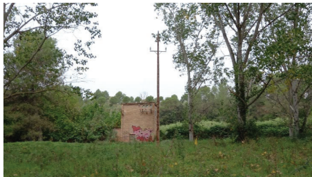
Figura 9 Tram de línia aèria de MT a desmantellar i reposar

El desmantellament i reposició de les instal·lacions de serveis afectades per l'execució del projecte es troben definides a l'Annex núm. 10 Serveis existents i afectats.