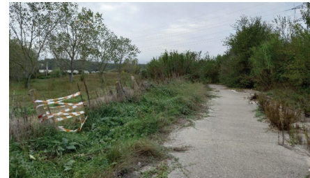
Figura 3 Tram inicial de l'antic camí de Distrivallès

Per tal d'efectuar les infraestructures hidràuliques objecte del present projecte, així com per recuperar la dinàmica natural del sòl en zones antropitzades que es preveu naturalitzar, s'ha previst la retirada de l'asfalt de l'antic camí d'accés a la planta de Distrivallès.