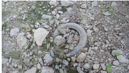
Figura 1 Detall de pneumàtic entre el sediment de la llera

Tot i que no s'han identificat grans abocaments de deixalles localitzats, sí que s'han pogut observar restes de deixalles i runes disperses al llarg de tot l'àmbit fluvial, acumulades a la llera o marges de la riera de Sant Cugat i els diversos torrents de l'àmbit d'estudi.