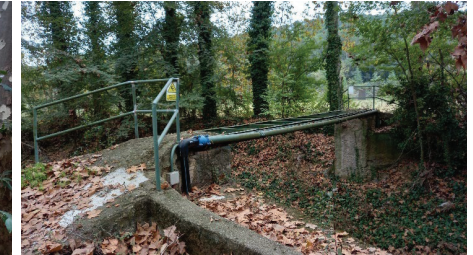
Figura 11 Passera amb serveis obsolets a la zona 6 Can Costa

Per tal d'assolir els treballs amb seguretat, és convenient començar el procés pel desmantellament de les conduccions de fluids i altres instal·lacions que queden vistes; en aquest cas es poden desmuntar fàcilment sense afectar la resistència o l'estabilitat de l'element constructiu en contacte amb elles.