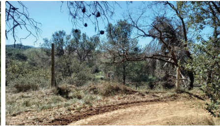
Figura 13 Tanca existent a la zona 10 Mirador