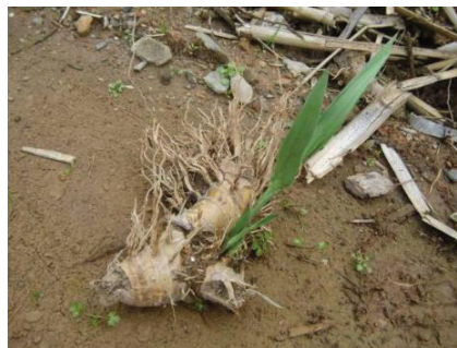
Figura 15 Rizoma no enterrat que conserva les capacitats de rebrotar