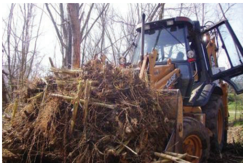
Figura 14 Procés mecànic d'eliminació de canya.