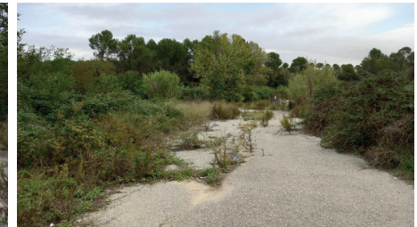
Figura 4 Tram final de l'antic camí de Distrivallès