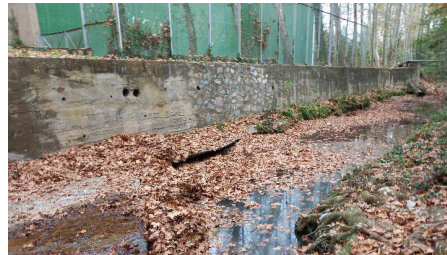
Figura 6 Mur de contenció de formigó executat in situ al marge esquerra de la llera a la zona 6 Can Costa

D'altres estructures de formigó existents a l'àmbit de projecte es troben actualment encara soterrades, com són les fonamentacions de les antigues instal·lacions de Distrivallès.