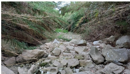
Figura 7 Diversos trams de llera escullerada a la zona 1 Meandre

Finalment, també hi trobem diverses zones on la llera es troba escullerada. En base als estudis hidràulics efectuats, alguns d'aquests trams d'escullera estan justificats i es retiraran per tal de recuperar la dinàmica natural. No obstant, es mantindran totes aquelles zones escullerades on hidràulicament sigui recomanable mantenir aquesta infraestructura.