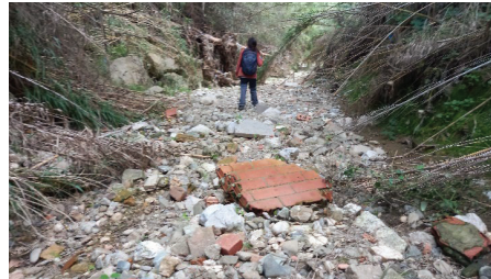
Figura 2 Restes disperses de residus inerts ceràmics

La quantificació i classificació detallada d'aquests residus es troba definit a l'Annex núm. 17 Estudi de gestió de residus.