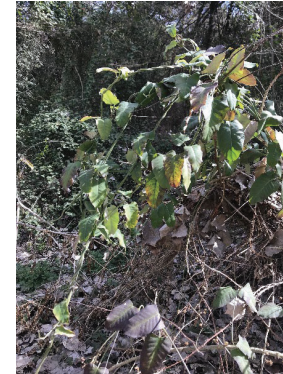
Figura 16 Araujia sericifera

El fals miraguà caldrà també retirar-lo mecànicament però amb suport manual. Es tracta d'espècies invasores que tenen un impacte rellevant sobre la fauna autòctona, especialment sobre els insectes degut a que les seves fulles desprenen substàncies on s'hi queden enganxats i moren. Cal retirar-los de la zona amb cura per evitar la seva propagació.