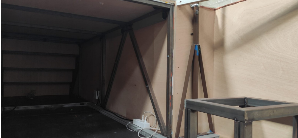
Plataforma tron 2: