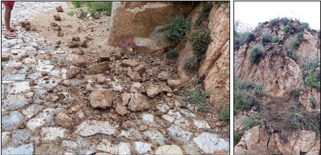
Despreniments sobre el vial d'accés