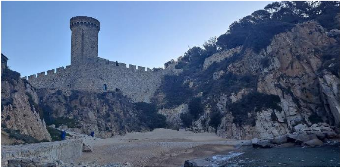
Platja d'es Codolar envoltada per penys-sehats