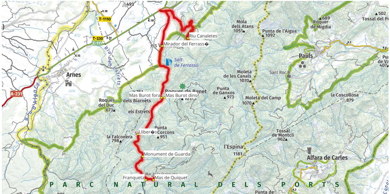
Localització amb cartografia 1/100.000. Plànol sense escala