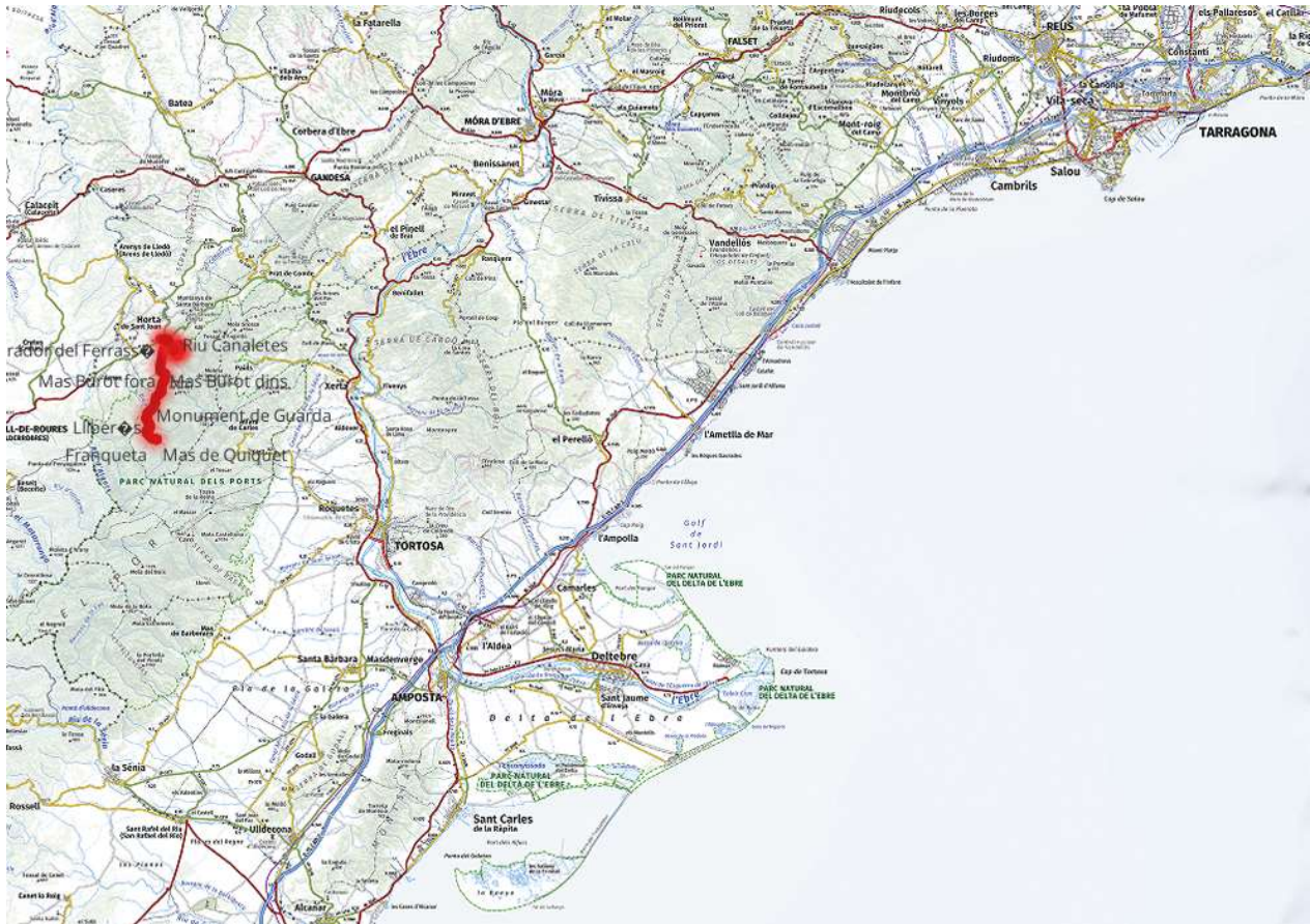
Localització amb cartografia 1/250.000. Plànol sense escala