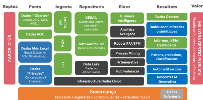
Figura 1. Plataforma de dades del Món Local

El present projecte planteja el desenvolupament, manteniment i gestió d'una plataforma de dades sobre una infraestructura de cloud públic a AWS, i que implementi un llac de dades ( data lake ) per a les administracions locals, permeti l'ús d'eines d'anàlítica avançada i possibiliti processos d'aprenentatge emprant grans volums de dades ( Big Data ).