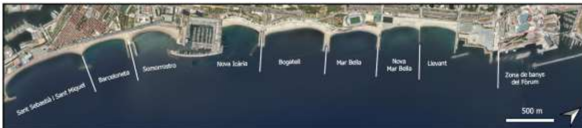
Figura 1. Imatge aèria de les platges de Barcelona.

El litoral metropolità de Barcelona és un sistema format per un conjunt de platges amb un caràcter marcadament antropogènic ( Fig. 1 ). Aquestes platges, majoritàriament d'origen artificial, formen part d'un sistema costaner extremadament dinàmic que experimenta modificacions constants com a resposta natural a l'acció de l'onatge i les corrents marines.