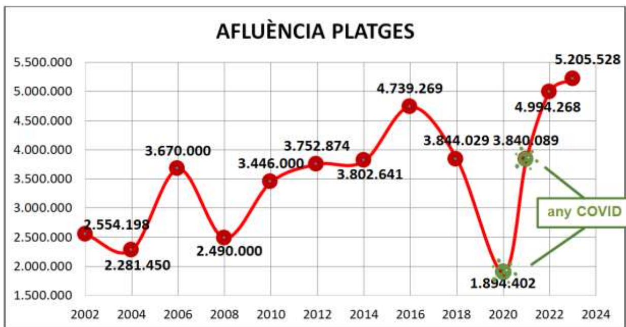
Figura 2. Afluència de les platges de Barcelona (2002-2024)

Amb una longitud d'uns 5 km i una superfície d'uns 200.000m 2 , les platges reben una gran afluència durant la temporada de bany. Exceptuant anys especials com el 2020 i el 2021 afectats per la COVID-19, durant les darreres temporades de bany les platges han rebut afluències d'entre 4 i 5 milions d'usuàries ( Fig. 2 ).