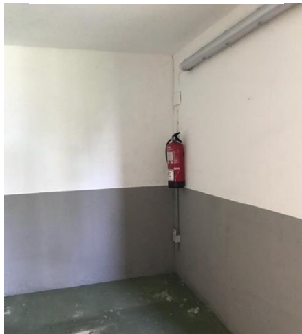
[Figura 3. Extintor ubicat a una cantonada dins del bar pícnic ]