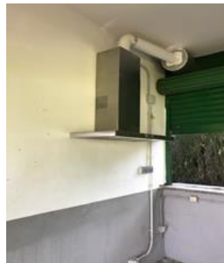
[Figura 4. Campana extractora d'acer inoxidable ]