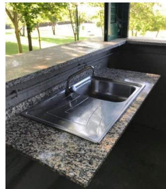
[Figura 2. Marbre i pica d'acer inoxidable ]