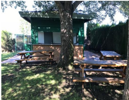
[Figura 1. Taules d'ús exclusiu del bar pícnic ]