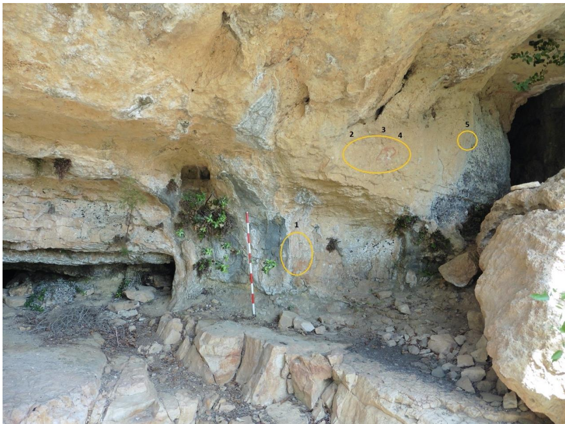
Imatges 1 i 2. Exemples de fotografies tractades al text de la memòria per a una millor comprensió.