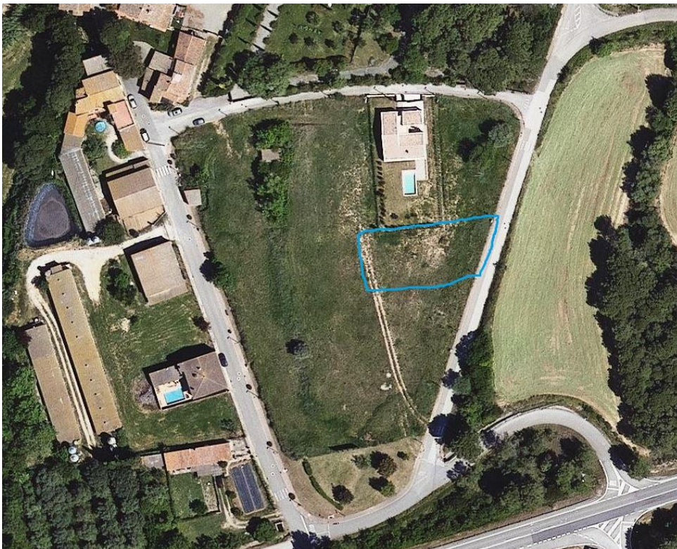
Situació de la parcel·la.