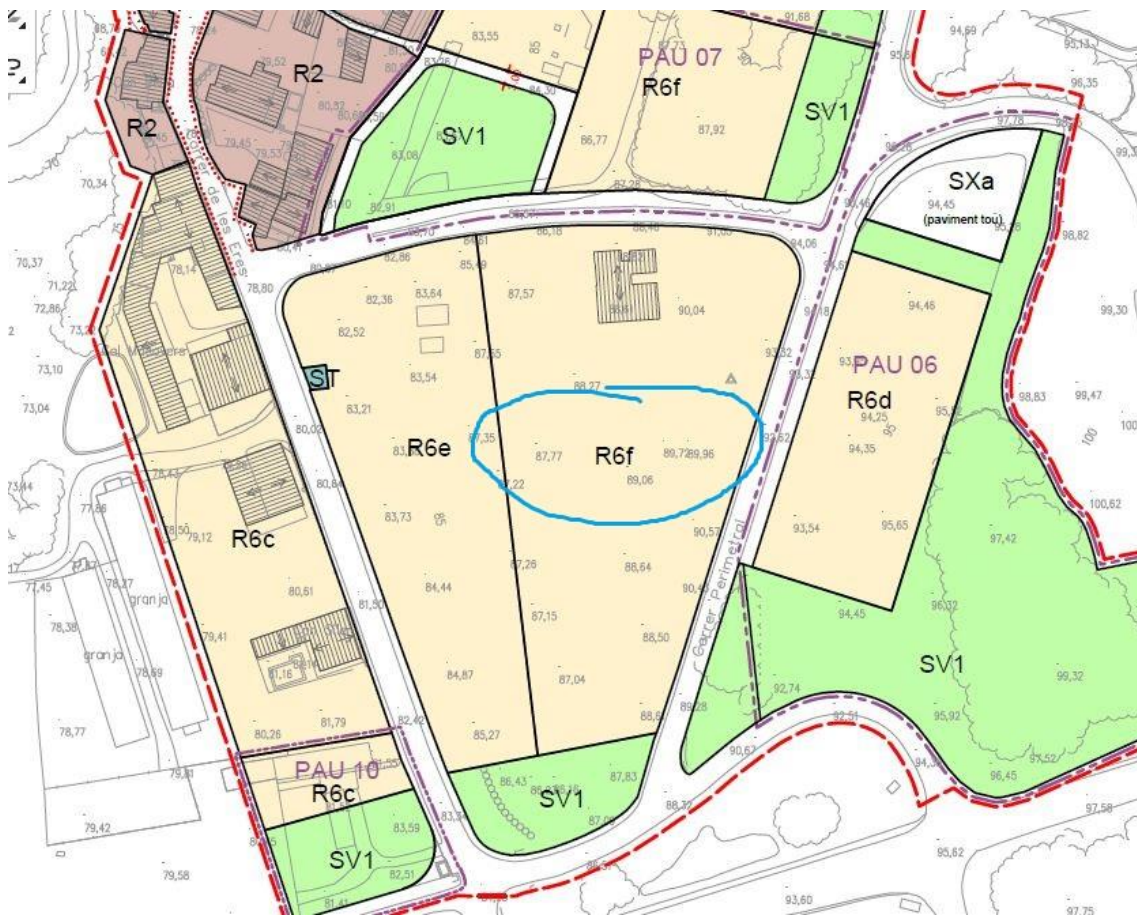
Situació de la parcel·la sobre plànol normatiu del POUM (aprovació inicial)