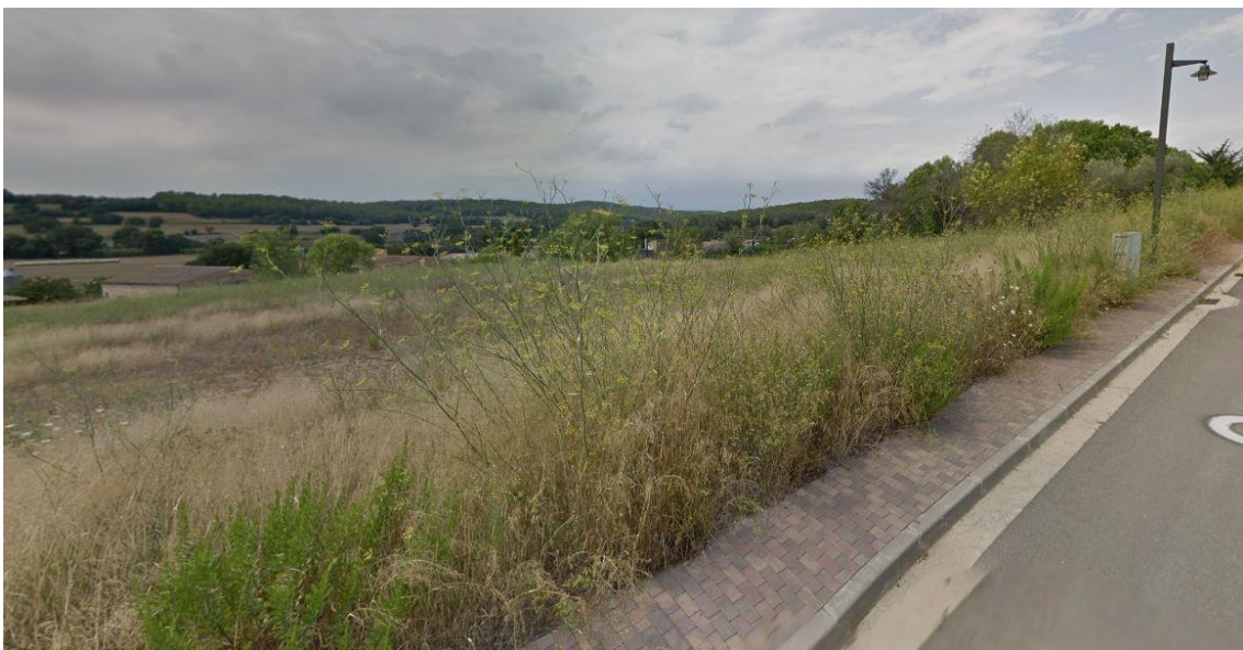
Fotografia de la parcel·la des del carrer.