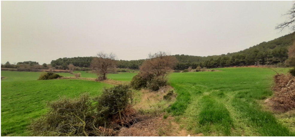
Fotografia de la finca en direcció nord-oest.