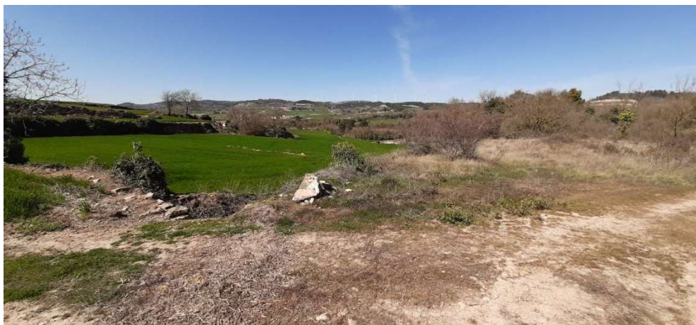
Fotografia de la finca en direcció nord-oest.