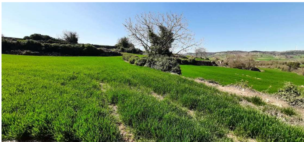
Fotografia de la finca en direcció est.