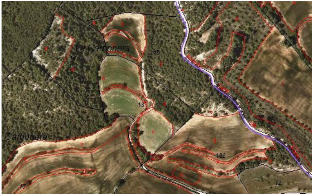
Fotoplànol amb superposició de base cadastral (ICC).