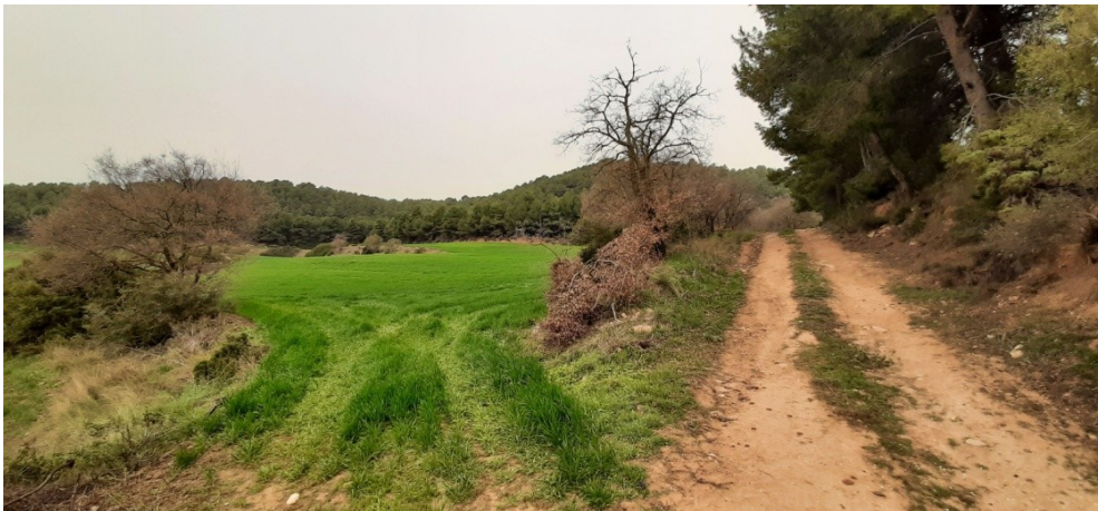
Fotografia de la finca en direcció sud.