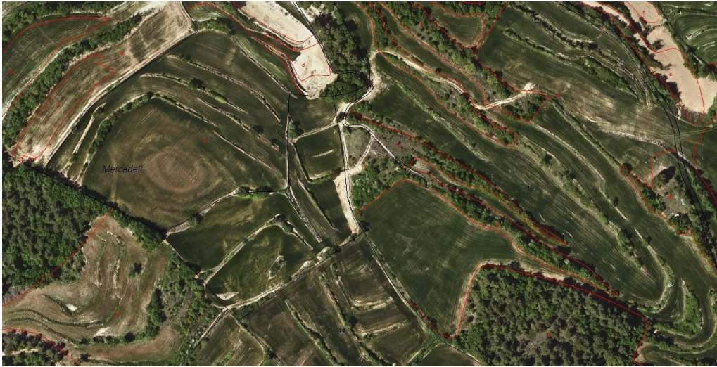
Fotoplànol amb superposició de base cadastral (ICC).