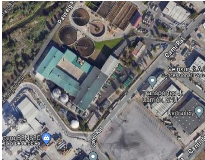
Figura 1. Vista aèria del Consorci.

El Consorci es troba ubicat al Camí Ral, s/n de Granollers. Les coordenades són: latitud (41°34'00.0"N) i longitud (2°16'19.5"E).