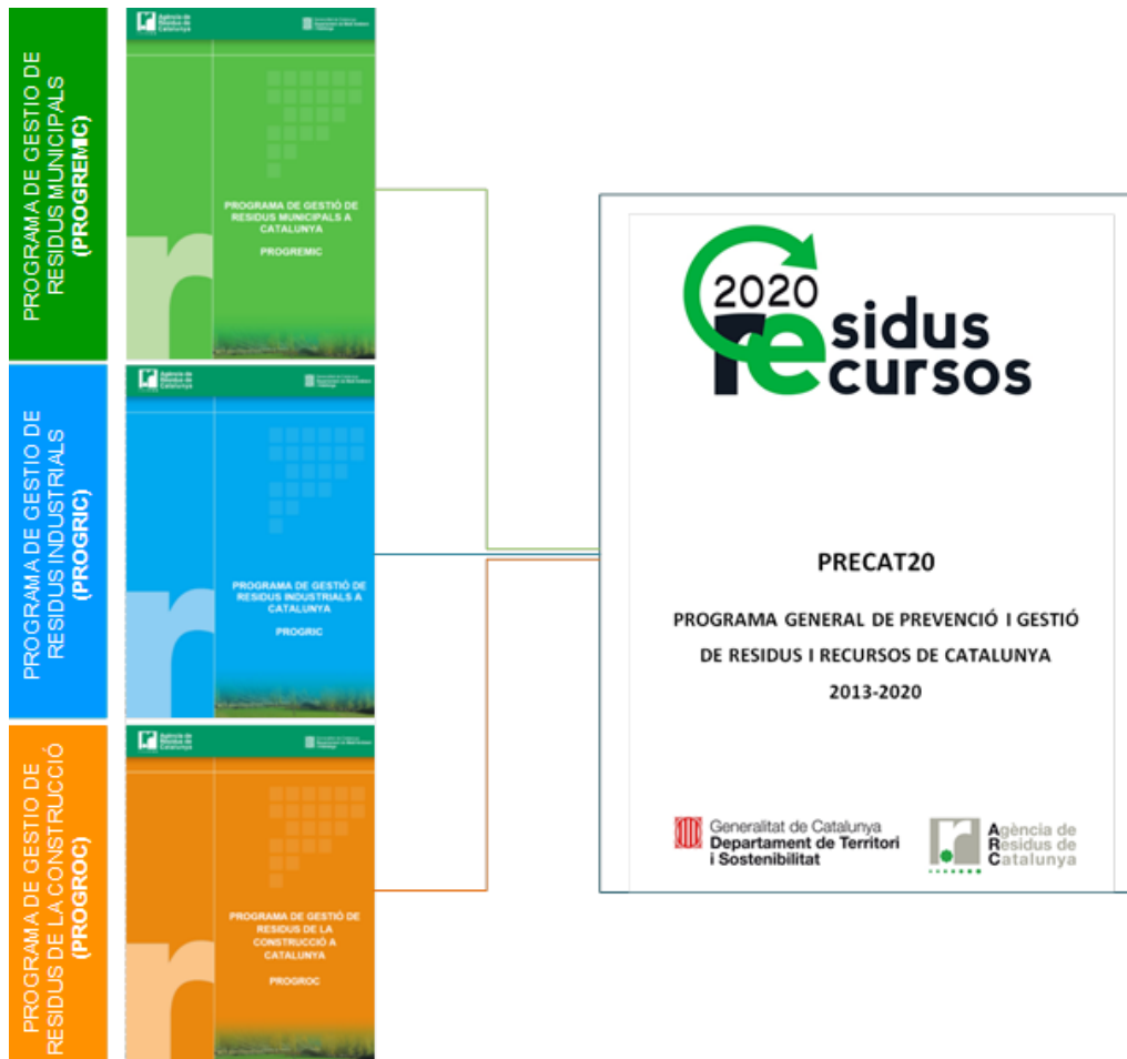
Figura 1. Antecedents programàtics del PRECAT20

El context de la gestió de residus ha patit canvis significatius en els darrers anys que requereixen una revisió profunda de la planificació. L'entrada en vigor de la Directiva 2008/98/CE, sobre residus, i de la Llei 11/2011, de residus i sòls contaminats, ha suposat l'establiment de nous objectius i criteris de gestió que els programes sectorials han de consolidar i reforçar. Així mateix, l'aposta per l'ús eficient dels recursos i la gestió dels residus és un dels pilars de la societat del reciclatge que proposen les estratègies europees.