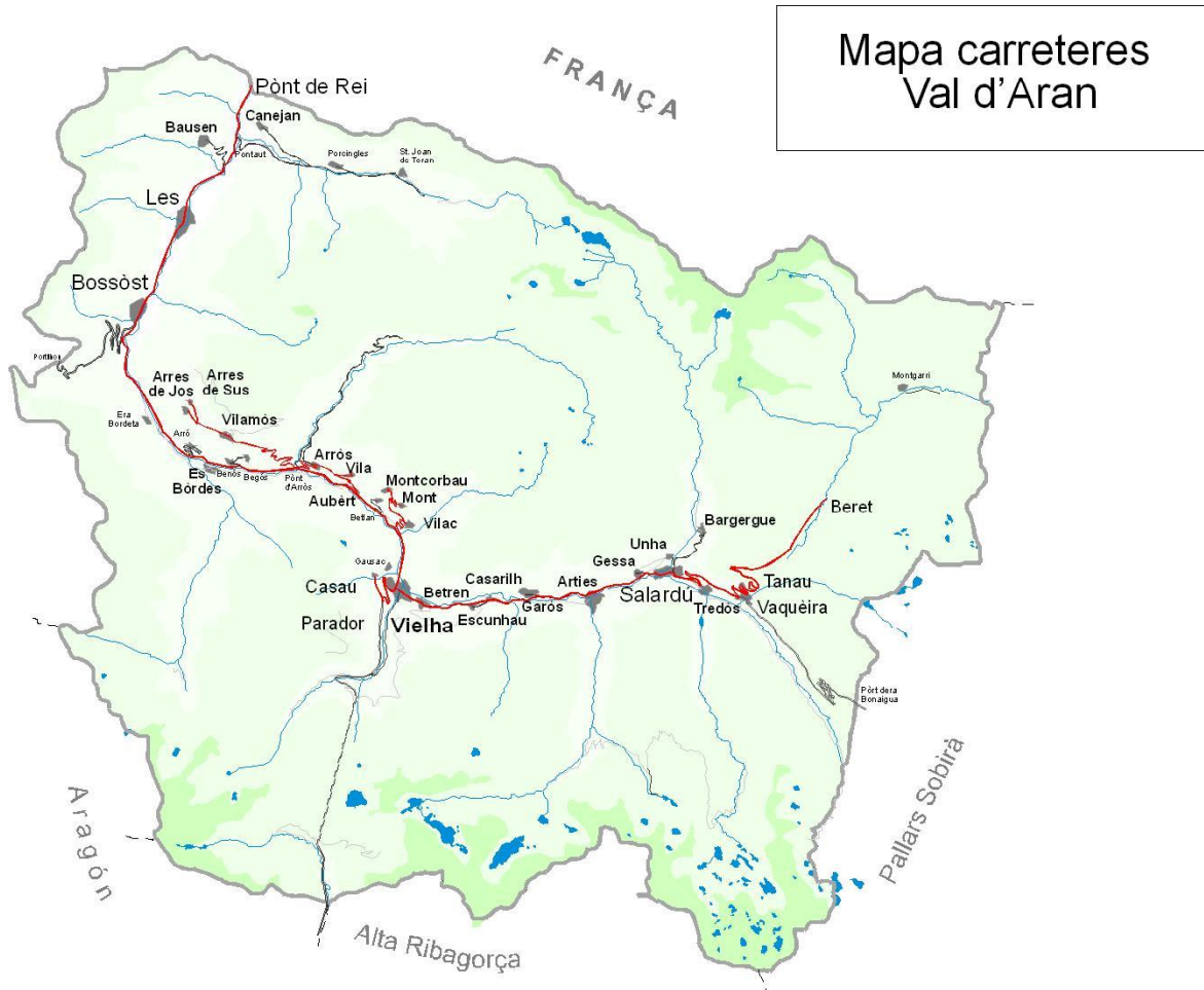
Mapa carreteres Val d'Aran

En el mapa següent es pot veure la cobertura territorial del conjunt del servei, que s'estructura seguint les carreteres: