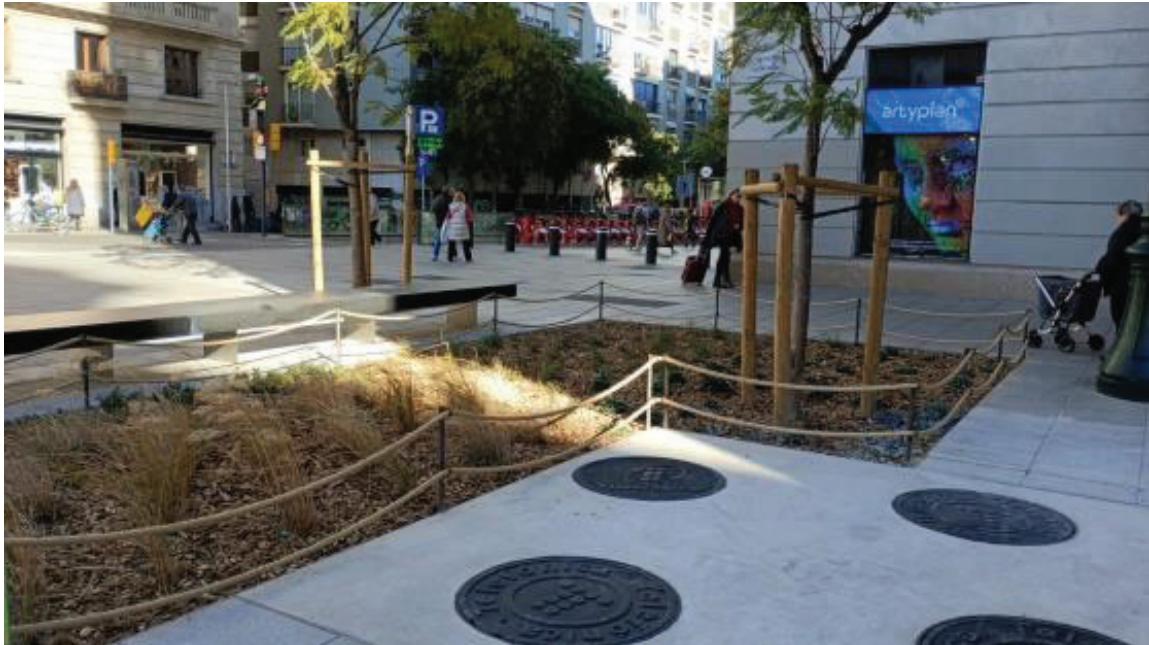
Imatge: Tanca instal·lada als parterres de Via Laietana.

Imatge de referència pel que fa a la tanca de senyalització de límit de parterre tipus “ rodó amb doble corda ”: