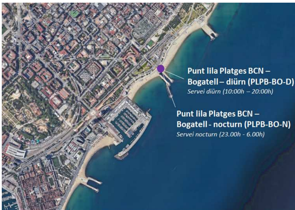
Fig 1.- Ubicació del Servei de Punts Liles a les platges de Barcelona

La ubicació dels dos punts liles coincideix, i es detalla a la Fig. 1: