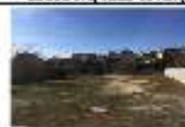
19. SOLAR JOSEP JOVEN (CAFETERIA)