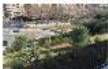
11. UNDA APOBENTADA