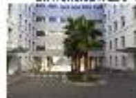
16. PATIERS DE LLOC ULLSANT