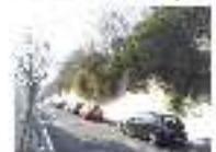
24. PARTERRE DE CANIBS SAUC