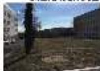
14. ESPAI PERA CANIBS SAUC