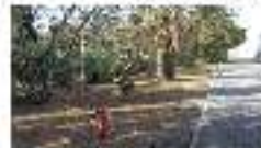
13. PASSEIG DE SARRIEN