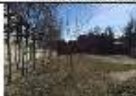
21. SOLAR NECS VILLOVICA