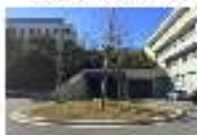
12. RECINTO DE LLIBS A VILA VELLA