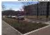
15. PARTERRE SAUC