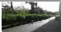
17. TALLS LLIVANT