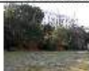
20. TINDS AGRS UNICARSA