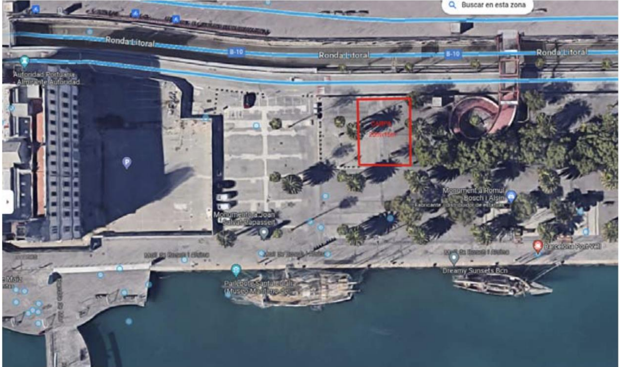
Situació en el Moll de la fusta

Plànol d'ubicació i esquema de panells del perímetre de la carpa.