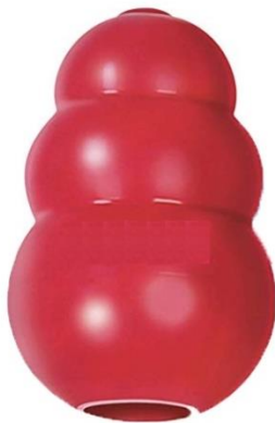
Imagen representativa diseño clásico y dureza normal

Disponible en, como mínimo, 2 tamaños: mediano y grande.