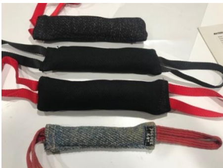
Imagen representativa mordedor tela francesa