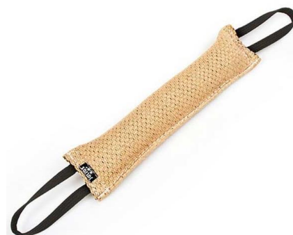
Imagen representativa mordedor yute