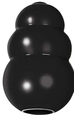
Imagen representativa diseño clásico y dureza extrema