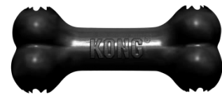
Imagen representativa diseño en forma de hueso y dureza extrema