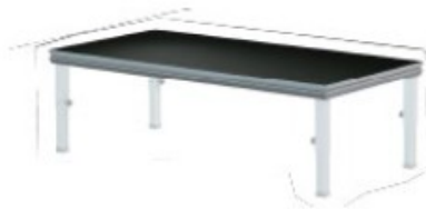
Figura 1. Mòdul de tarima tipus Layher

S'adjunta fotografies representatives de les prestacions que es sol·liciten en aquest plec: