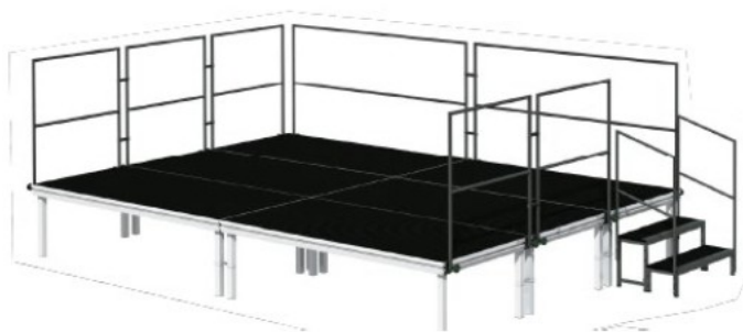
Figura 2. Tarima modular muntada tipus Layher