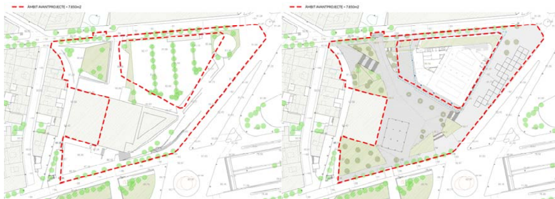
Àmbit de l'avantprojecte en l'Estat actual i amb la proposta de nou mercat.

La reurbanització de l'entorn del nou mercat, serà la primera fase que es podrà executar. L'espai restant de la plaça (on s'ubica el mercat actual), amb execució prevista en dues fases, no es podrà construir fins que el nou mercat estigui acabat perquè l'antic mercat seguirà la seva activitat fins que es traslladi al nou emplaçament.