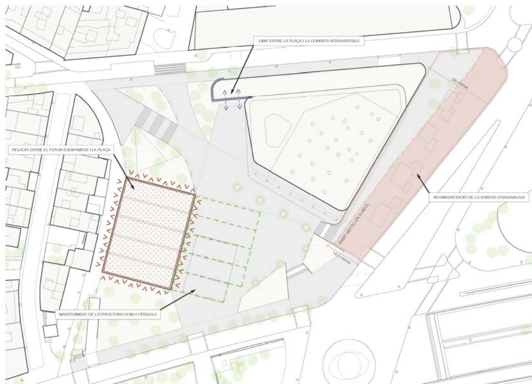
Identificació dels punts crítics en la proposta dels Estudis previs.

Es demana la redacció de projectes executius diferenciats (fase 2 i fase 3) per tal que puguin executar-se tant de manera conjunta com separada, en funció de les necessitats municipals arribat el moment de la seva execució, prevista a posteriori del projecte executiu de la fase 1, el mínim per a garantir l'obertura del mercat.