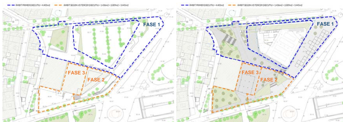
Àmbit dels projectes executius en l'Estat actual i amb la proposta de nou mercat. En blau, el projecte executiu de la fase 1, mínim per a l'obertura del nou mercat. En taronja, els projectes executius de les fases 2 i 3, que inclouen l'enderroc parcial de l'antic mercat.

La resta de projectes d'espai públic vinculats als Estudis previs (la reurbanització del carrer Aiguablava, la coberta de les cotxeres de TMB i la rotonda de Via Favència) no tenen un calendari d'execució definit i aniran vinculats a altres projectes de transformació com són la construcció dels habitatges de l'IMHAB o el cobriment de la Ronda de Dalt.