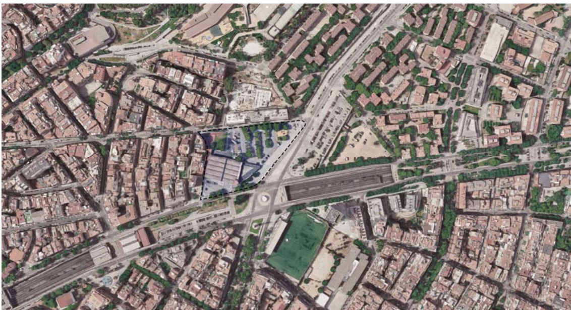
Ubicació de l'àmbit d'actuació.

Aquesta decisió va obrir la porta a fer un Estudi d'encaix urbà d'aquest nou equipament en relació amb el seu entorn pel fet que es troba en una posició nodal de primer nivell en el Districte de Nou Barris: la cruïlla entre la Via Favència i la Via Júlia, que és el punt d'encontre dels barris de les Roquetes, Verdun, la Prosperitat i la Trinitat Nova, amb tres teixits urbans diferents.