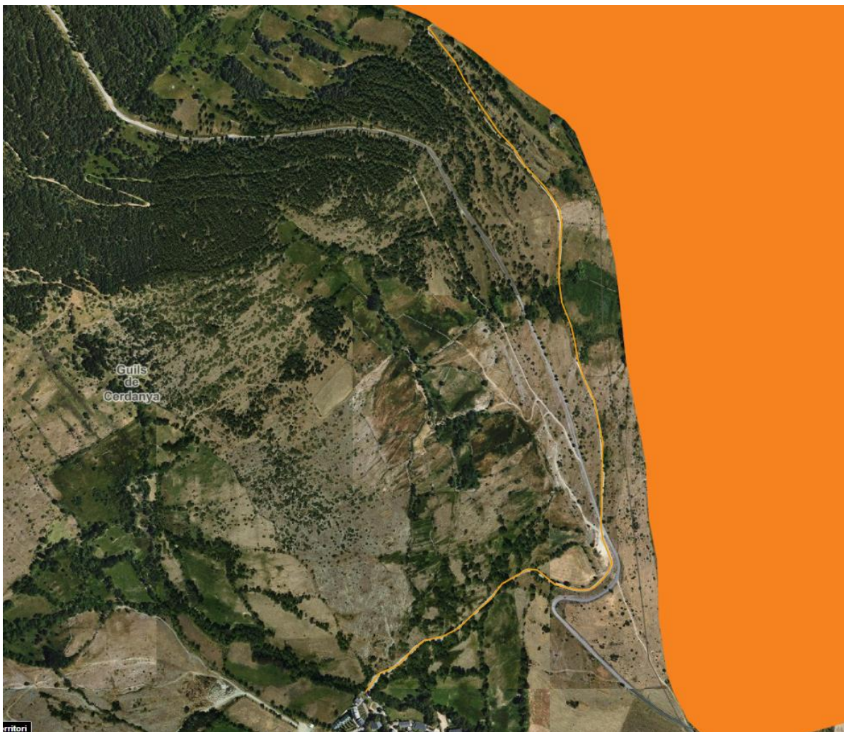
Camí de Pardalís