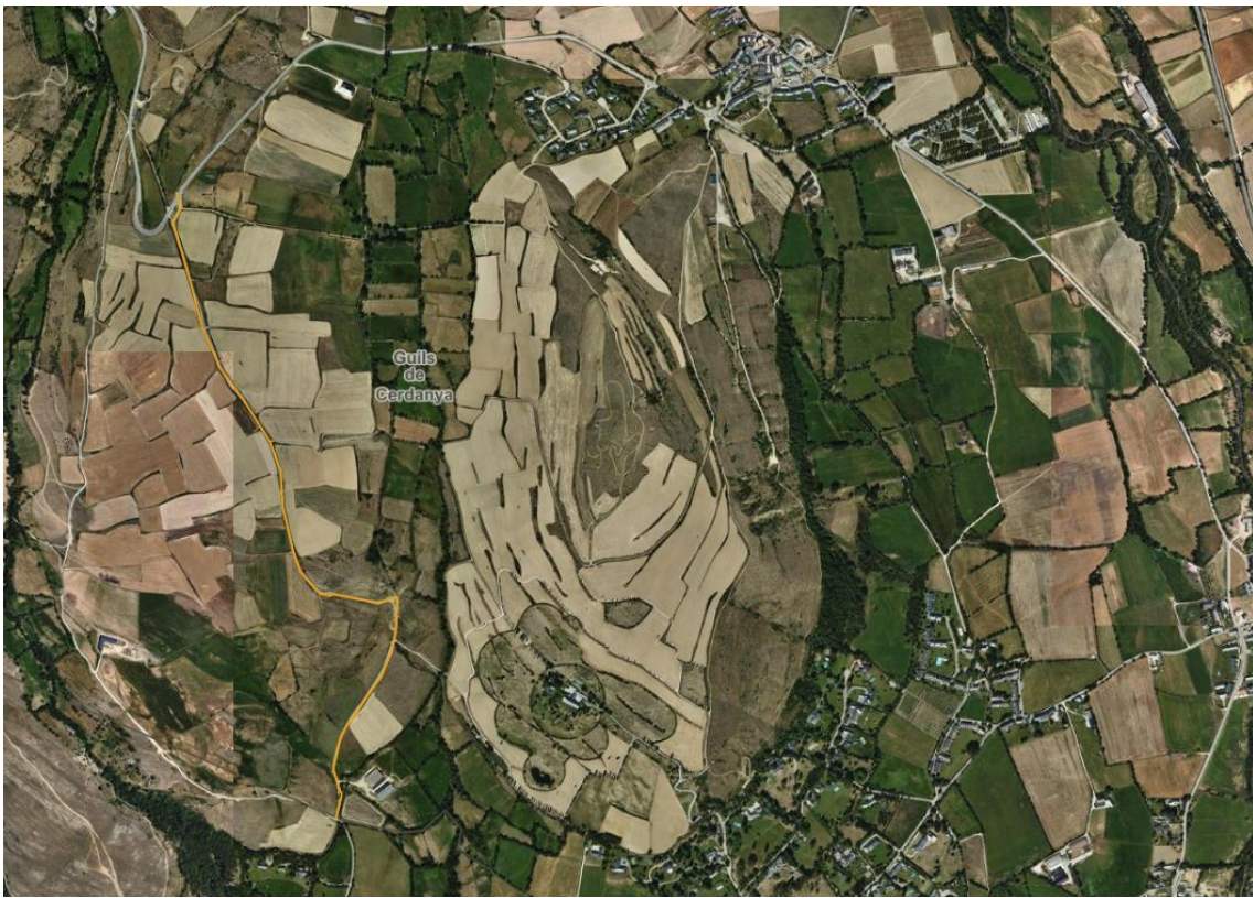
Camí de la Carrera