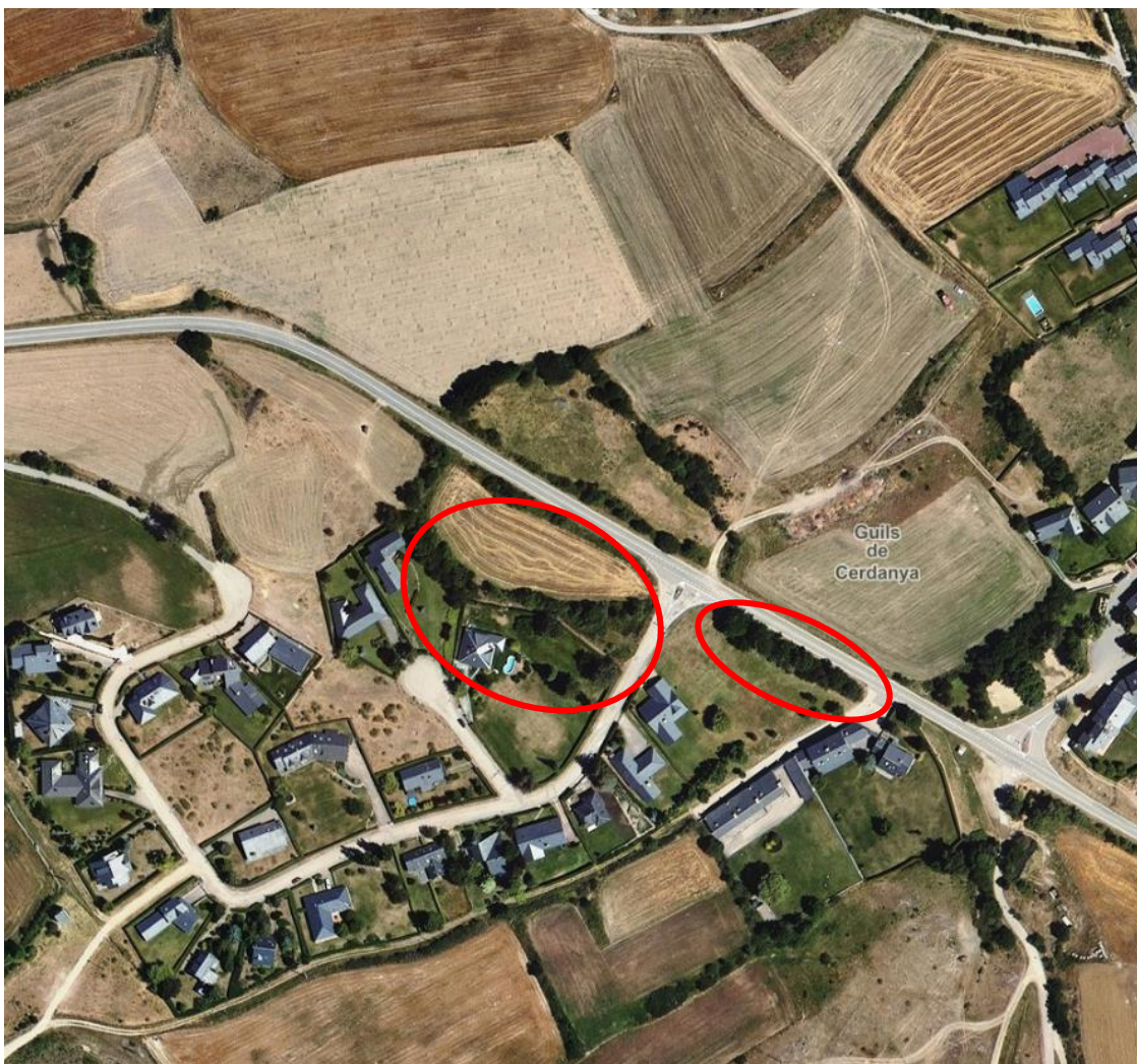
Desbrossada de parcel.les