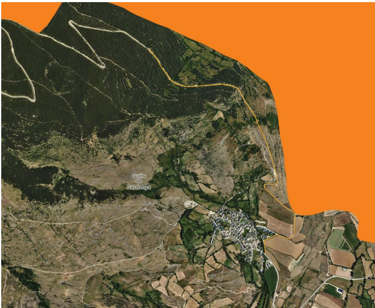
Carretera de la Muntanya